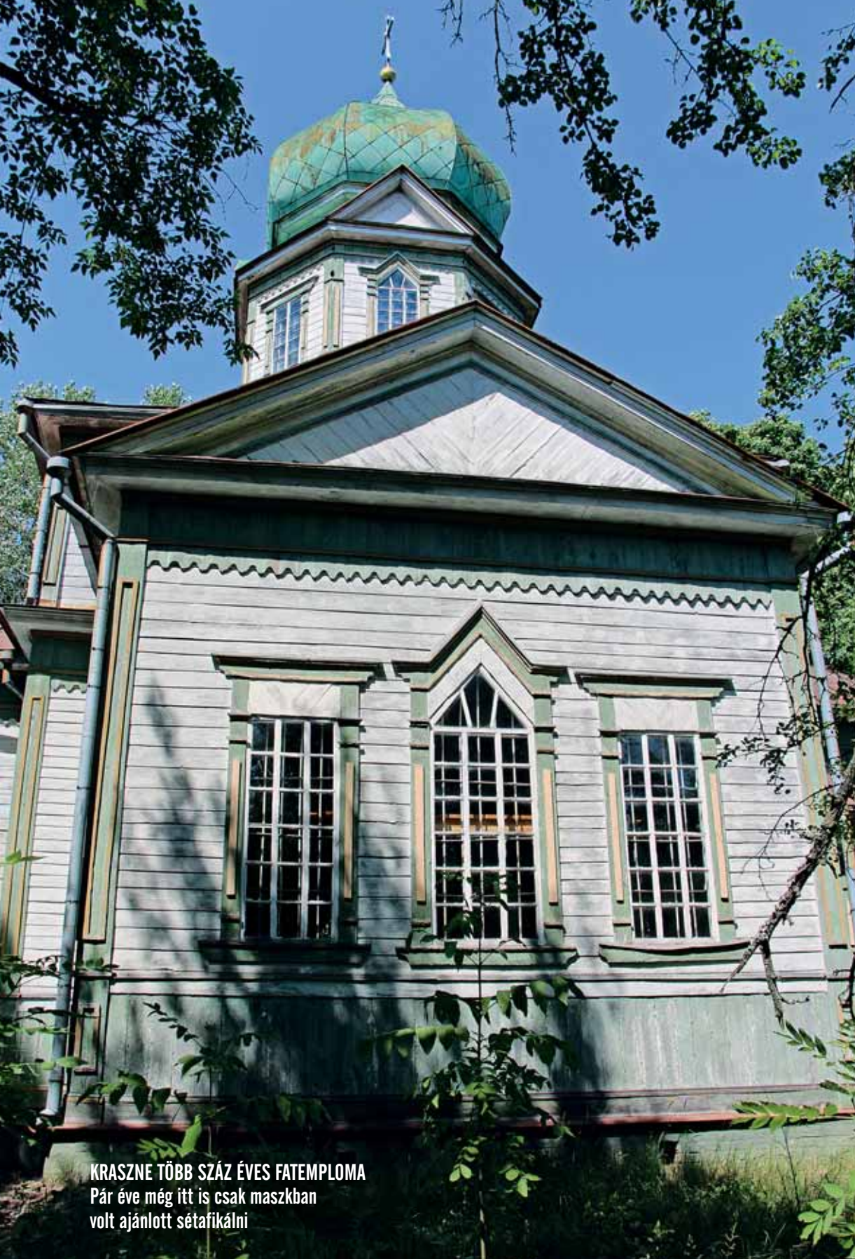
KRASZNE TÖBB SZÁZ ÉVES FATEMPLOMA Pár éve még itt is csak maszkban volt ajánlott sétafikálni