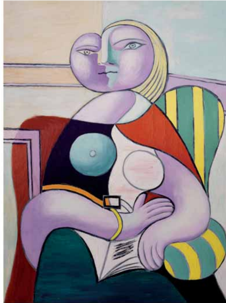
Pablo Picasso: Olvasó nő, 1932 © Dation Pablo Picasso, 1979, MP137 © RMN-Grand Palais (Musée national Picasso-Paris)/René-Gabriel Ojeda © 2016 - Succession Pablo Picasso - HUNGART