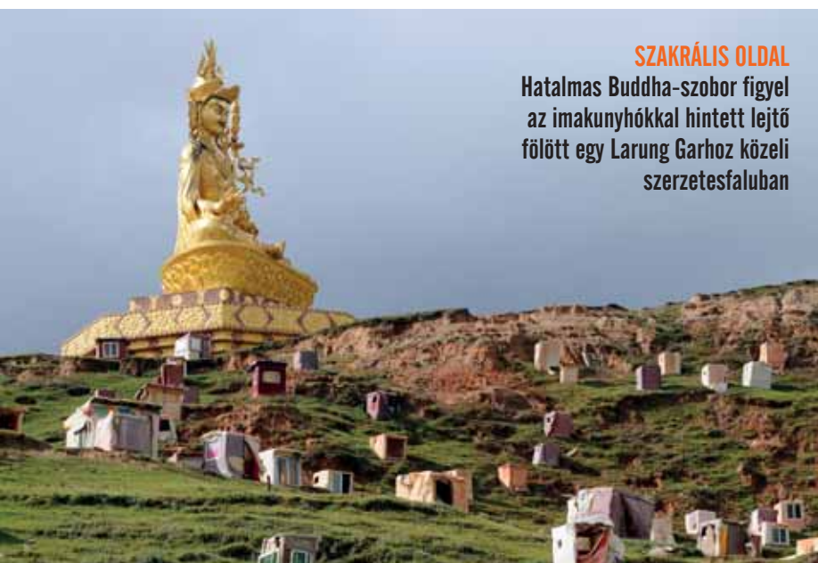
SZAKRÁLIS OLDAL Hatalmas Buddha-szobor figyel az imakunyhókkal hintett lejtő fölött egy Larung Garhoz közeli szerzetesfaluban