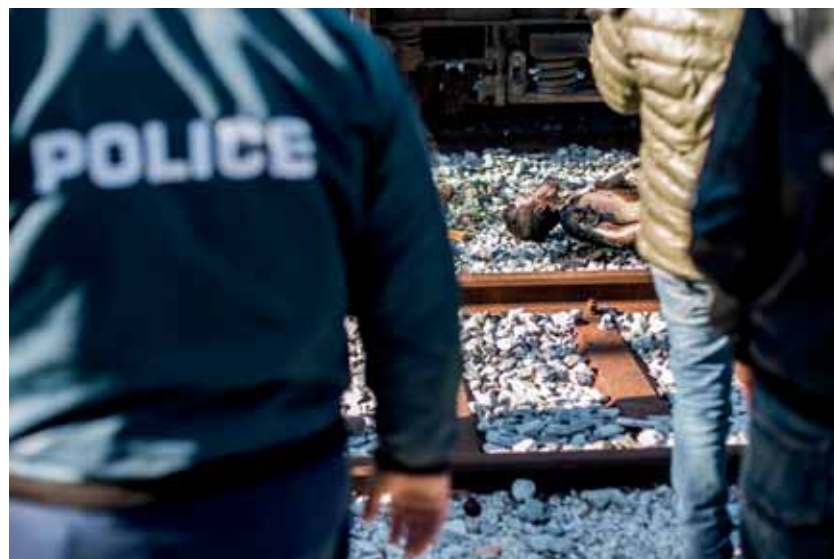
A SÍNEK KÖZÖTT... Egy fiatal marokkói férfi megégett holt- teste. Elkeseredésében felmászott egy vonat tetejére, és a magas- feszültségű vezetékét megfogva végzett magával