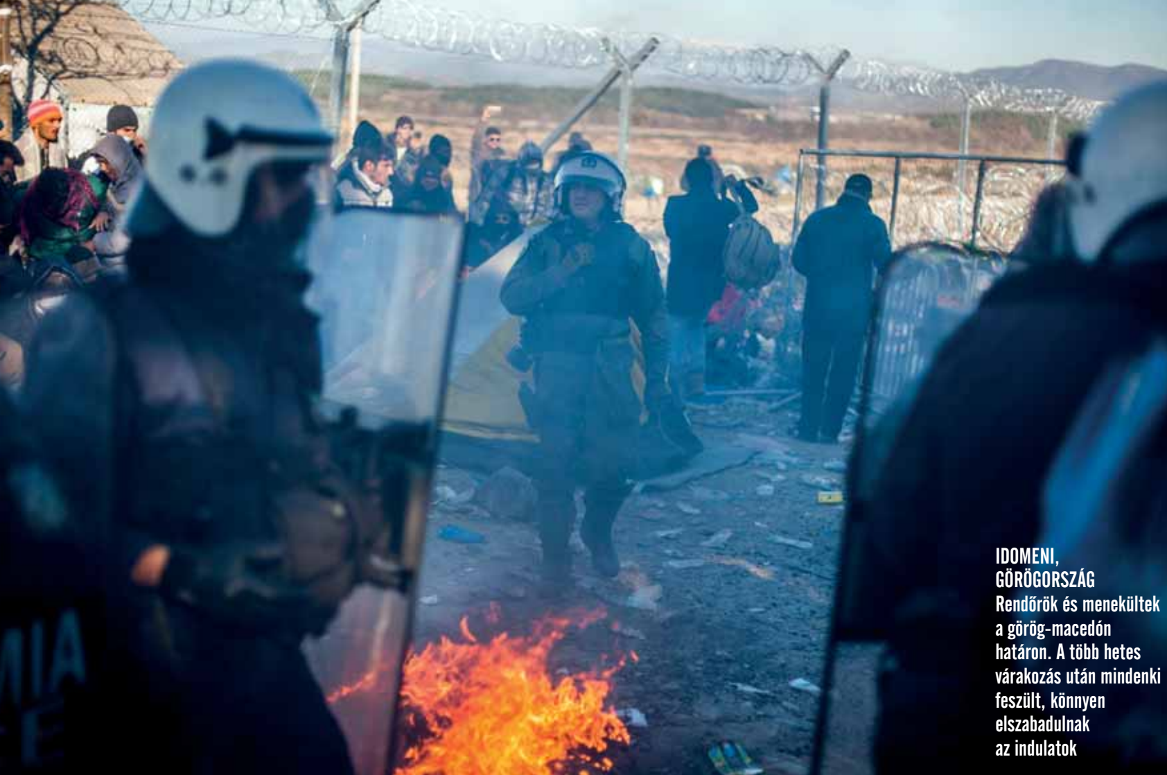
IDOMENI, GÖRÖGORSZÁG Rendőrök és menekültek a görög-macedón határon. A több hetes várakozás után mindenki feszült, könnyen elszabadulnak az indulatok