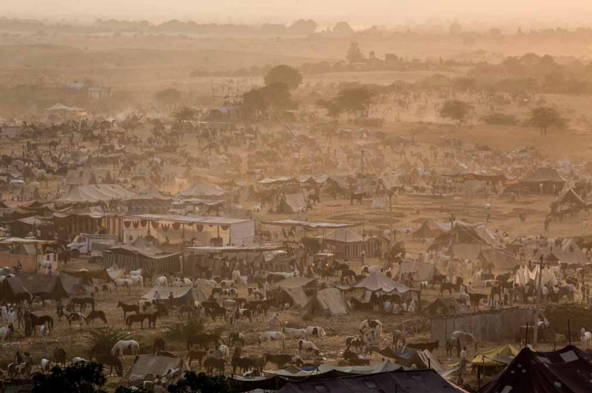
A VILÁG LEGNAGYOBB ÁLLATVÁSÁRA A bő egyhetes vásár csúcspanjain húszezernyi teve és ló zsúfolódik össze Pushkar határában