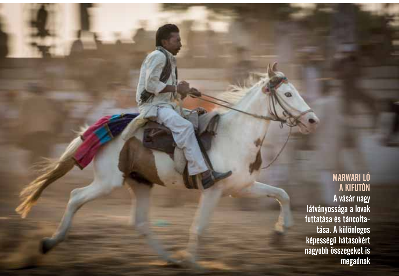
MARWARI LÓ A KIFUTÓN A vásár nagy látványossága a lovak futtatása és táncoltatása. A különleges képességű hátasokért nagyobb összegeket is megadnak