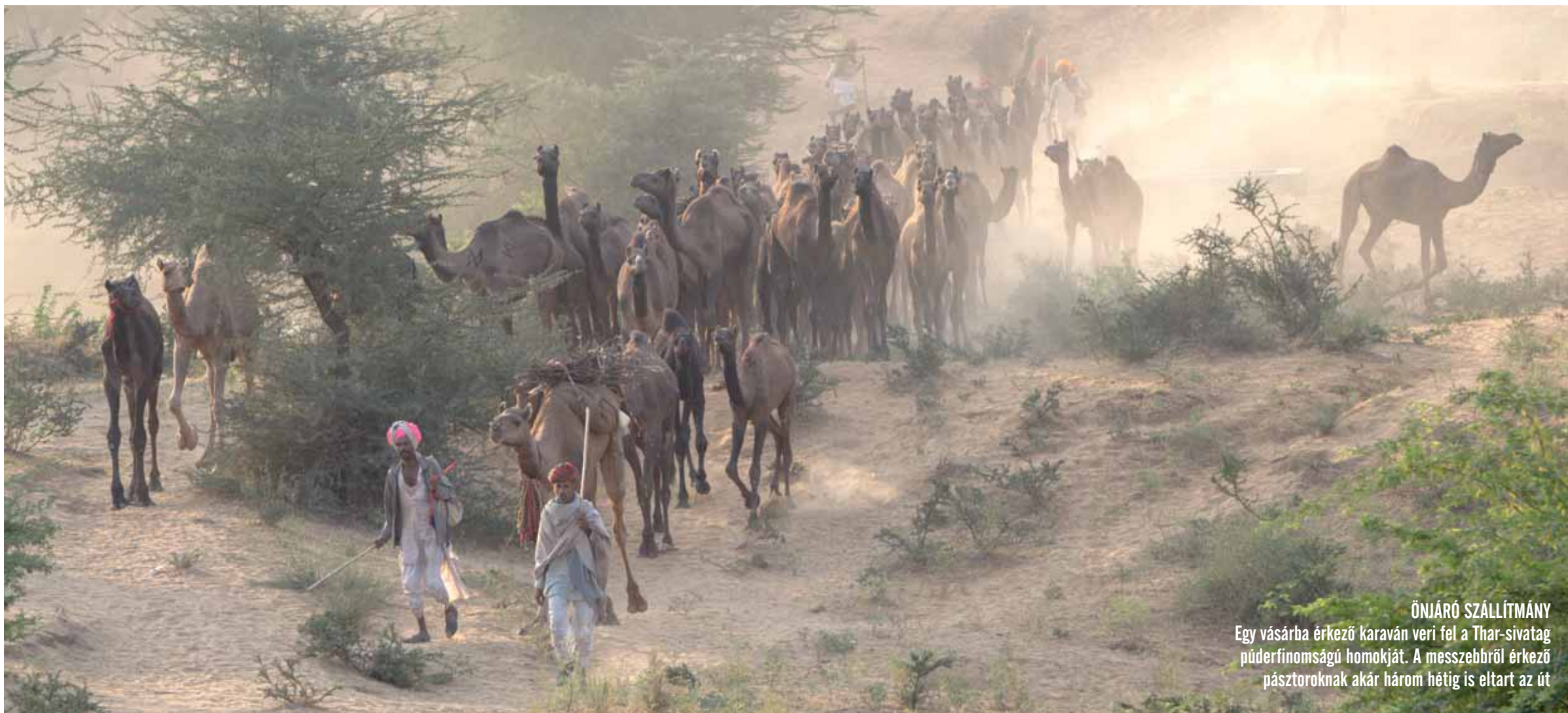
ÖNJÁRÓ SZÁLLÍTMÁNY Egy vásárba érkező karaván veri fel a Thar-sivatag püderfinomságú homokját. A messzebről érkező pásztoroknak akár három hétig is eltart az út