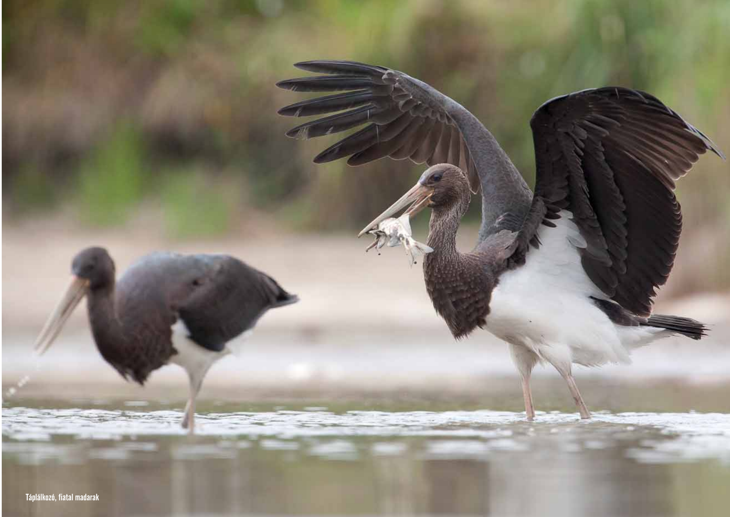
Táplálkozó, fiatal madarak