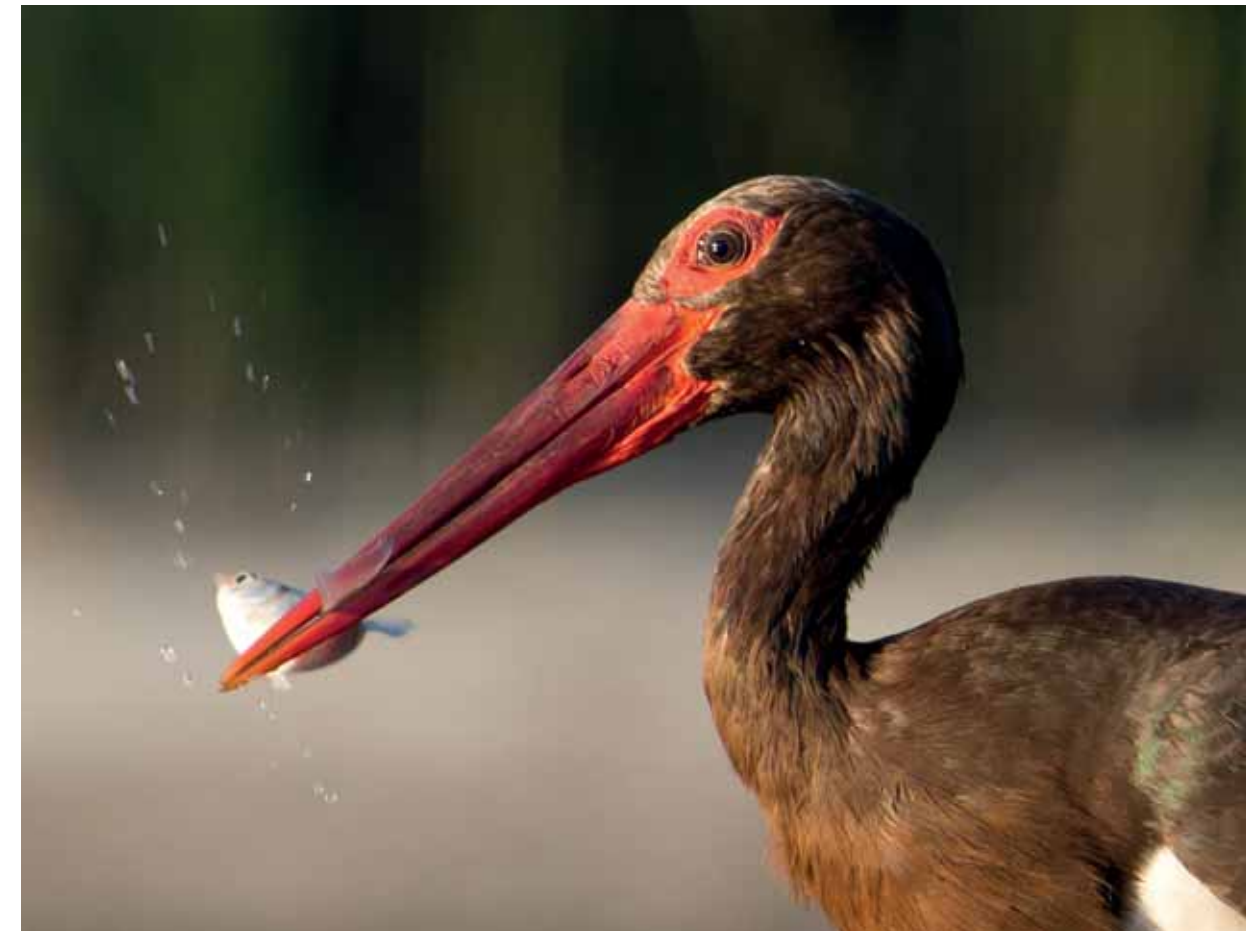
FIATAL, IDEI FÉSZEKALJBÓL SZÁRMAZÓ MADÁR egy törpeharcsa társaságában. Jól megfigyelhető a fiatal egyedek zöldesbarna csőr- és lábszíne