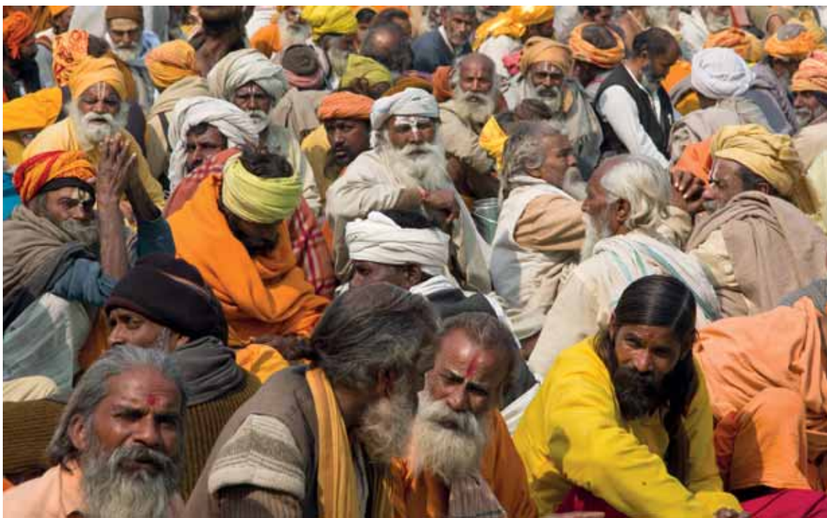
A SZÁDHUK EBÉDJE. Mindennap más a vendéglátó. A leghíresebb Swamik sátraikban naponta 3-6000 szádhut ebédeltetnek meg (lent)