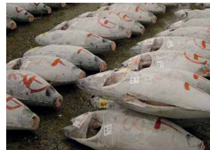
MÉTERES TONHALAK A HALPIACON (jobbra fenn)