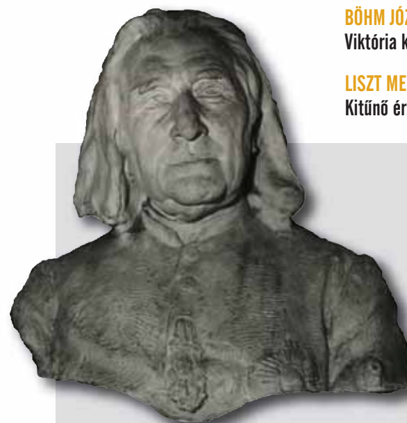
LISZT MELLSZOBRA Kitűnő érzéke volt az emberi karakterek megragadásához

Ám a tudásvágy hajtotta ifjú nem elégedett meg ennyivel. Egyre nehezebben viselve a feudális berendezkedésű Habsburg Birodalom nyomasztó, a művészi szabadságot erősen korlátozó légkörét, Angliába vágott, hogy továbbképezze magát. Az 1862-ben eredetileg csak tanulási céllal Londonba érkező Böhm sok időt töltött a művészet szentélyének számító British Museumban. Az ott látott hatására alkotta első angolai szobrait, amelyekkel rövid időn belül felhívta magára a figyelmet. A szerencse is mellé szegődött: mivel akkortájt az angol arisztokráta körében divattá vált a szobor-