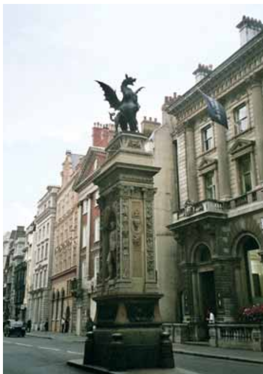
ALBERT HERCEG ALAKJA A TEMPLE BAR MEMORIALON Böhmnek több 19. századi köztéri alkotása ma is áll Londonban

portrék készíttetése, ezért szinte azonnal ellátták megrendelésekkel. A sikerek hatására Böhm a letelepedés mellett döntött, és három év múltán meg is kapta a brit állampolgárságot. Alkotásaival már az 1862-es londoni világiállításon olyan sikert aratott, hogy véglegesen a portrészobrászat mellett kötelezte el magát. Azt, hogy ez részéről mennyire jó döntés volt, a későbbi évek fényesen igazolták.