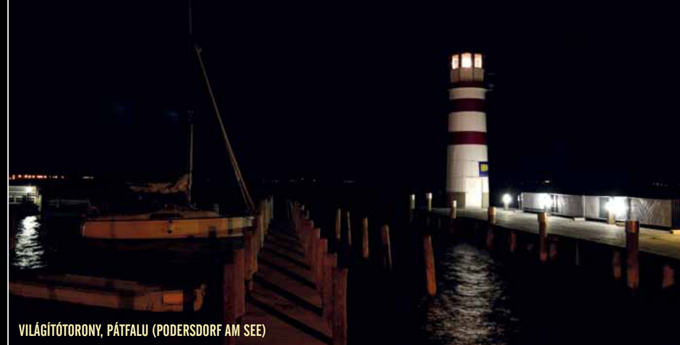
VILÁGÍTÓTORONY, PÁTFALU (PODERSDORF AM SEE)

megné. A nyugalomra térő települések csöndjét, ki- haltságát, a holdfényben fehérülő szürkemarhák, lo- vak némaságát, a folyamatos tücsökciripelésben egymagában suhanó kerékpár menetzaját megta- pasztalni különleges érzés. Sajátos az is, ahogy a ke- leti parton az északi horizontot a szélkerekek szá- zainak piros fényjátéka teszi futurisztikussá, hasonlóan az éjjel is működő különféle seregély- riasztók hanghatásaihoz. Egyébként az út a nappal- nál százszor biztonságosabb: csak néhol kell meg- küzdönnünk a párhuzamos országúton a szembe- jövő autók reflektorfényével, vagy az éjjel hazatérő, hirtelen irányváltotásra képes gyalogosokkal.