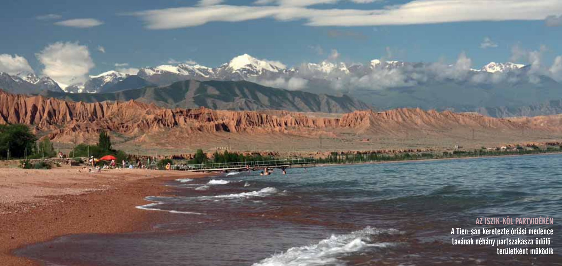
AZ ISZIK-KÖL PARTVIDÉKÉN A Tien-san keretezte óriási medence tavának néhány partszakasza üdülő- területként működik