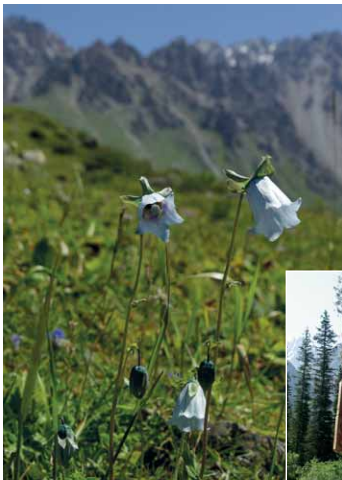
A VIRÁGZÓ ALA ARCSA NEMZETI PARK Közép-Ázsia hegyvidékei a botanikusok Paradicsoma. Számos növény géncentruma itt található, és ahol nincs túlegeltetés, elképesztő változatosságot találunk