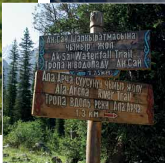
HÁROMNYELVŰ TÁJÉKOZTATÓTÁBLA Nemcsak a helyi turistákra számítanak...