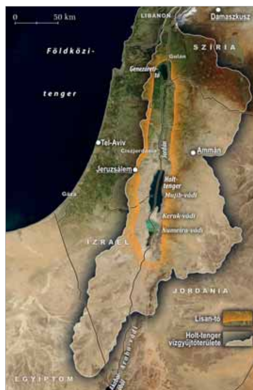
ÉLÉNK INGADOZÁS A TÓ VÍZSZINTJÉNEK VÁLTOZÁSA AZ EMBERI TÖRTÉNELEM FOLYAMÁN