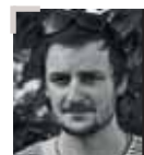
FEKETE ISTVÁN FOTÓRIPORTER, SZERKESZTŐ, ÉRDEKLŐDÉSI TERÜLETE A SPORT ÉS A TÁRSADALOM KAPCSOLATA