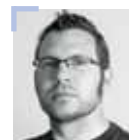
ANCSIN GÁBOR 2008-TÓL FOTÓZIK HIVATÁSSZERŰEN, A KÉPSZERKESZTŐSÉG ALAPÍTÓ FOTÓRIPORTERE