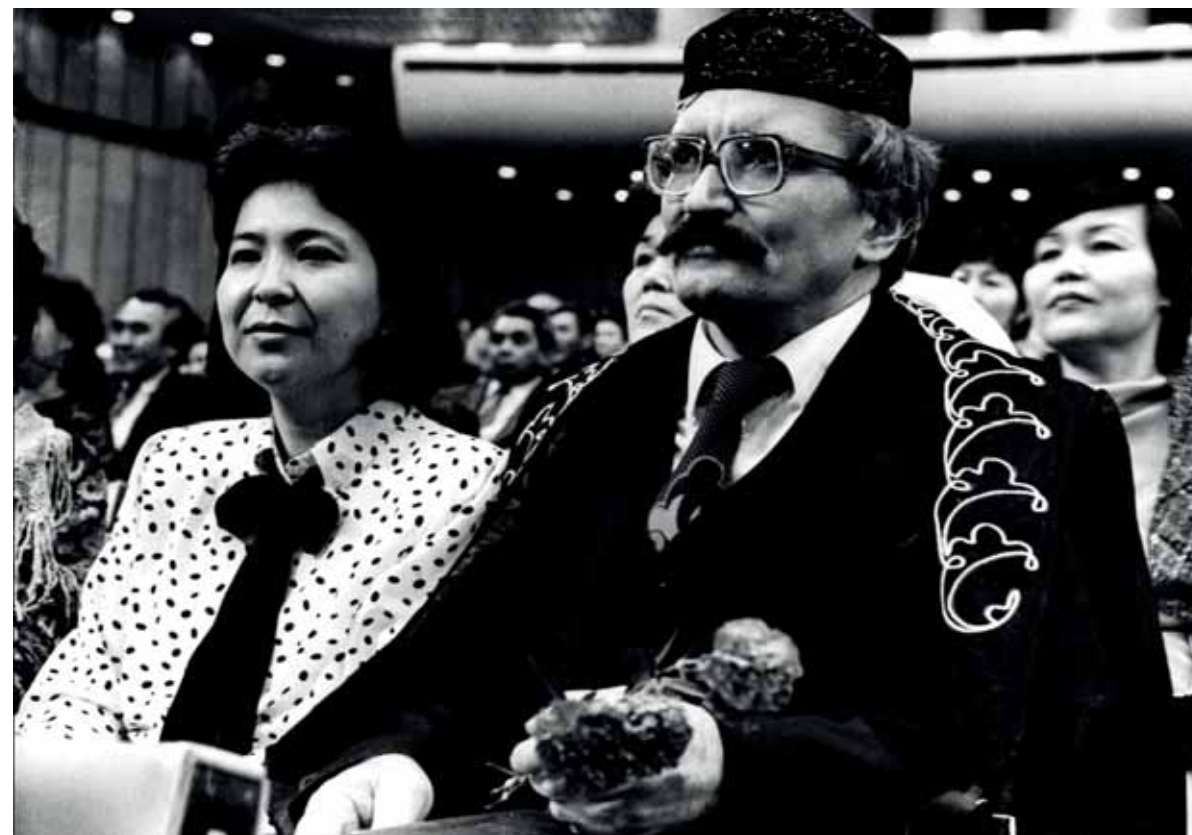
ALMATI, NÉPI KÖLTŐVERSENY FELESÉGÉVEL, A NYUGATKAZAH MAKSZUMKIZI ONGASJÁVAL A NÉZŐTÉREN

A kis Mándokyt leginkább a kunok elfeledett nyelve izgatta. Már gyerekkorában észrevette, hogy a kunok sok olyan szót használnak, melyek ismeretlenek más