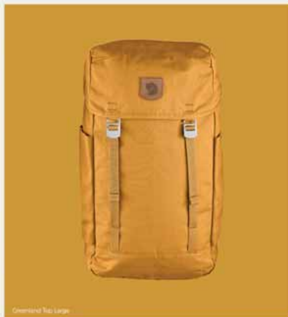
Greenland Wax Large

EGY SÚRŪN SZÖVÖTT poliészter és pamut anyag Greenland Wax réteggel impregnálva: a Fjällräven G-1000 az elmúlt 50 év során bebizonyította, hogy egyike az outdoor ipar legtartósabb és legerősebb anyagainak. A G-1000-ból készült darabokra alkalmazható több réteg wax maximálisan víz- és szélállóvá teszi a ruhát, ugyanakkor, ha jól szellőző öltözetre