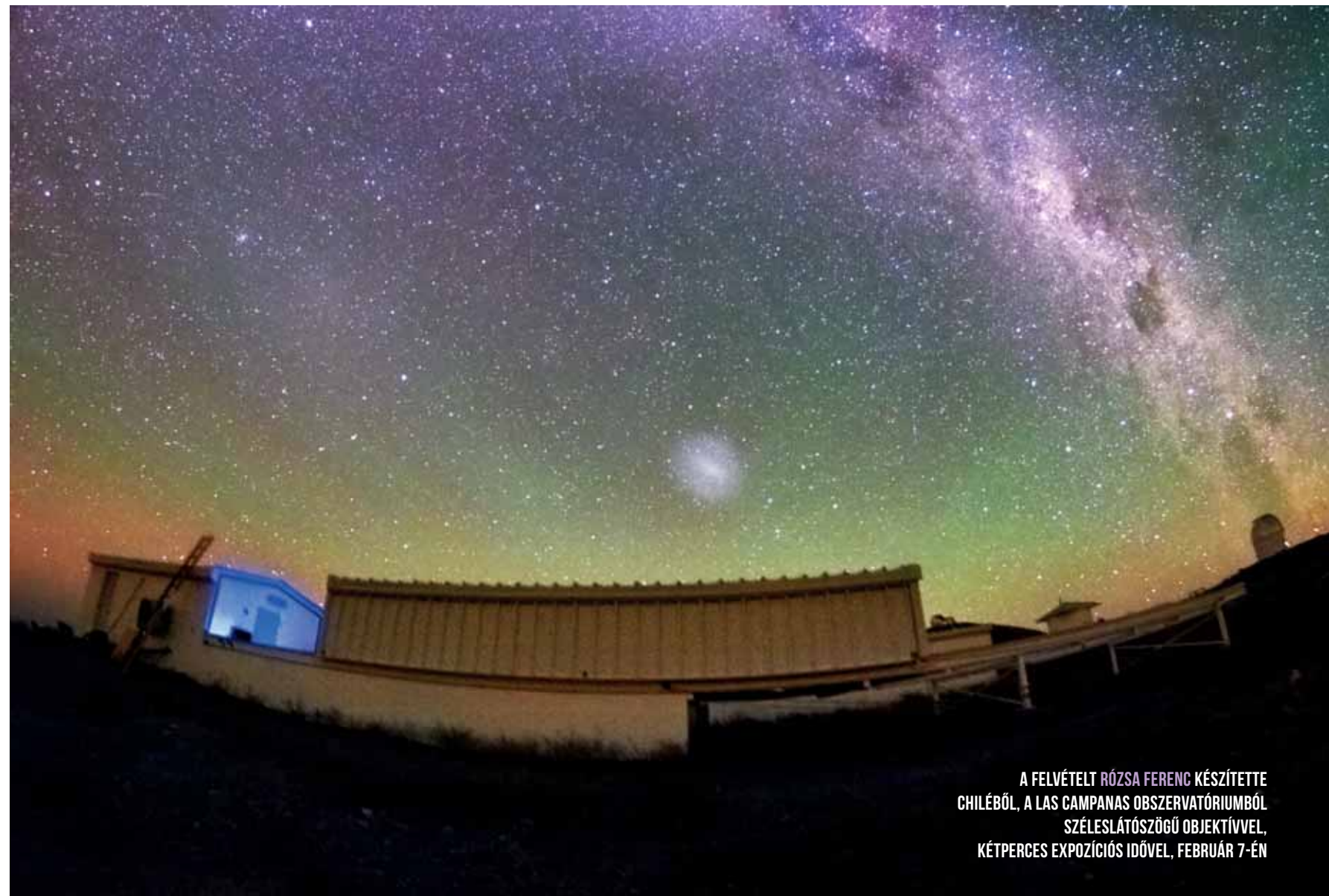
A FELVÉTELT RÓZSA FERENC KÉSZÍTETTE CHILÉBŐL, A LAS CAMPANAS OBSZERVÁTORIUMBÓL SZÉLESLÁTÓSZÖGŰ OBJEKTÍVVEL, KÉTPERCES EXPOZÍCIÓS IDŐVEL, FEBRUÁR 7-ÉN

A hajtóműből kiáramló égéstermék egy fokozatosan táguló „buborék”, amelyet a rakéta a hajtóműmanőver ideje alatt maga után húz, majd, ha leállt a hajtómű, a táguló és így egyre kisebb sűrűségű felhő gyorsan eloszlik a lég-