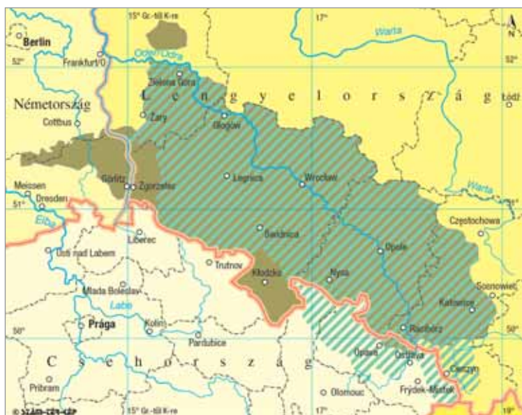
▨ POROSZ-SZILÉZIA A BÉCSI KONGRESSZUS (1815) UTÁN ■ SZILÉZIA A SZILÉZIAI HÁBORÚK (1742) ELŐTT MINT CSEH (NÉMET-RÓMAI ÉS HABSBERG)-KORONABIRTOK — ORSZÁGHATÁR - - - - TARTOMÁNYHATÁR