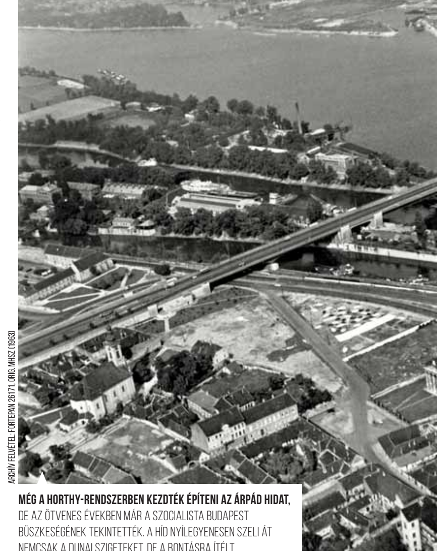
ARCHÍV FELVÉTEL: FORTEPAN 26171, ORIG. MHSZ. (1963)