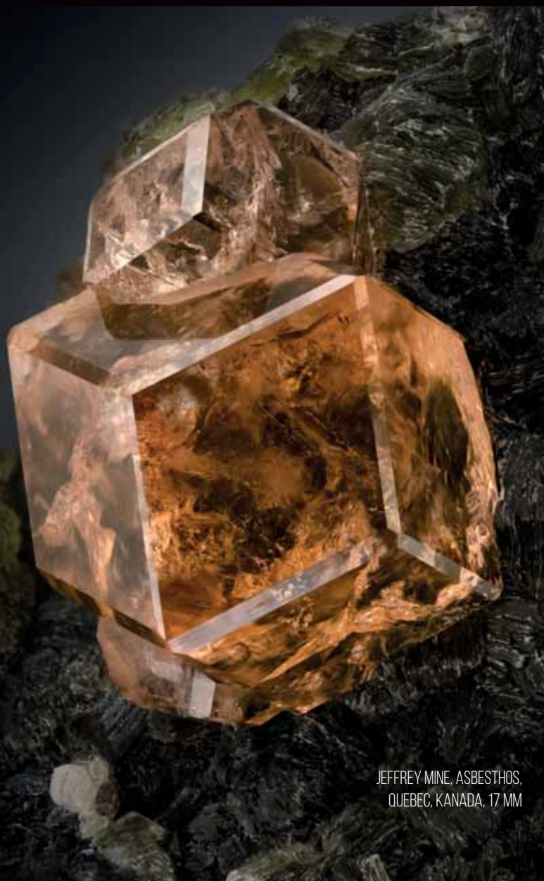
JEFFREY MINE, ASBESTHOS, QUEBEC, KANADA, 17 MM

Drágakő-minőségű példányait ékkőnek csiszolják, más felhasználási területe nem ismert.