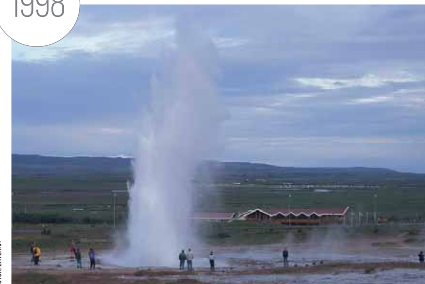
BEJÖTT! DIVATTÁ VÁLT! LÁTOGATÓK IZLAND NÉHÁNY PERCENKÉNT MŰKÖDŐ GEJZIRJE, A STROKKUR KÖRÜL, NYÁR DEREKÁN. KÉT ÉVTIZED ALATT BÓ TÍZSZERESÉRE(!) NÖTT A VENDEGFORGALOM