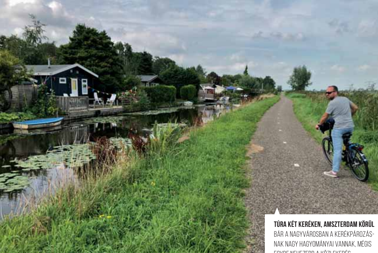
FOTÓ: HEILING ZSOLT