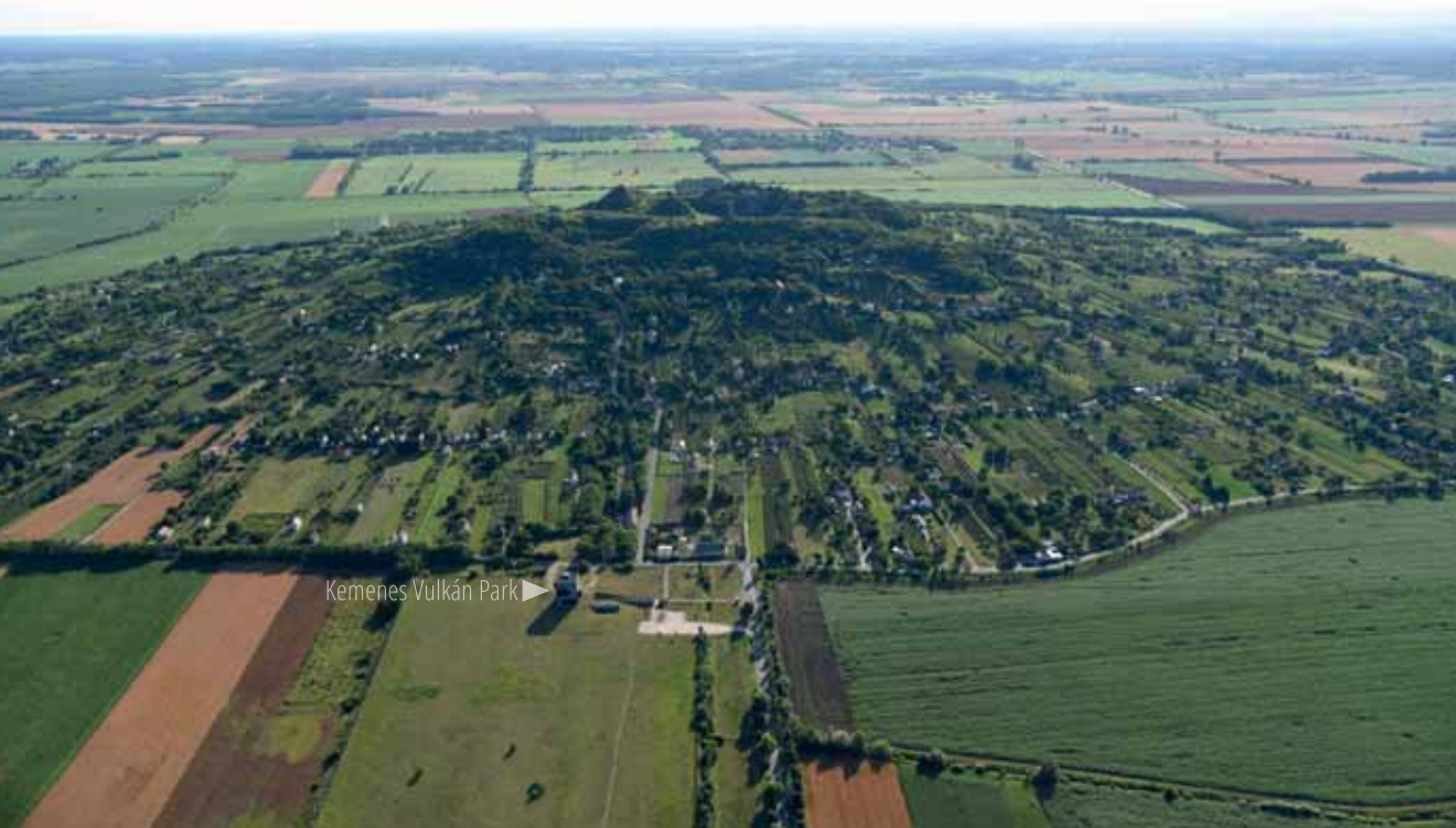
Kemenes Vulkan Park ▶