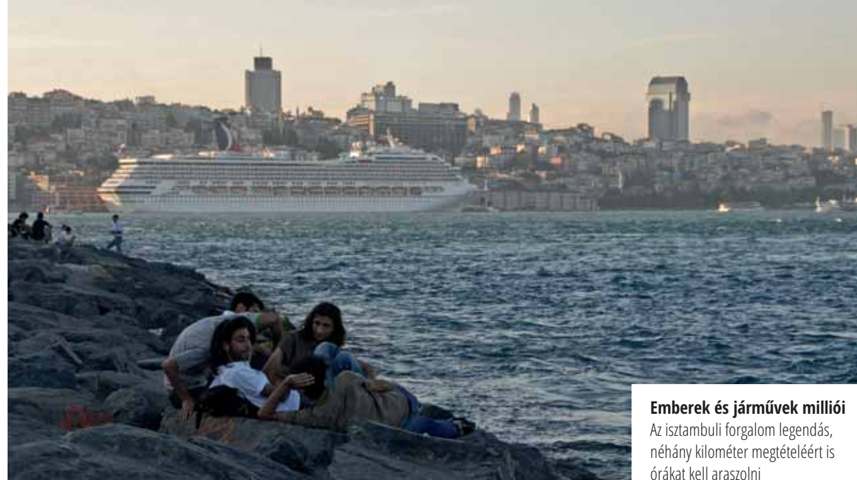
Emberek és járművek milliói Az isztambuli forgalom legendás, néhány kilométer megtételéért is órákat kell araszolni

A Boszporusz-híd 1973-ban készült el, de mára még két átjáró segíti a hatalmas forgalmat Európa és Ázsia között. 2016 óta Július 15. vértanúinak hídjaként nevezik