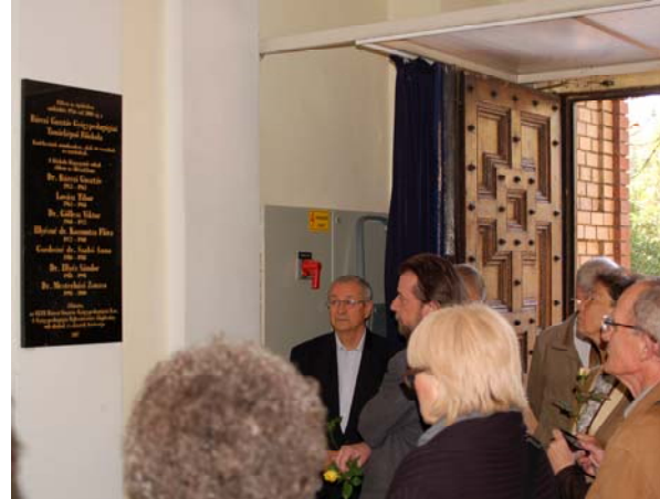
Az emléktábla a bejárat jobb oldalán