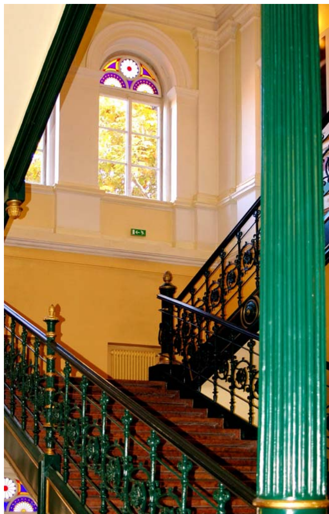
A főlépcső ma