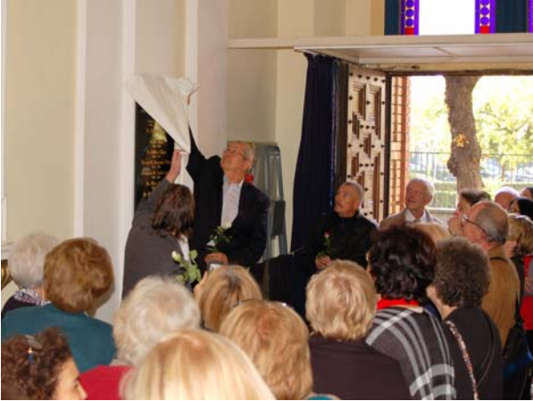
Az emléktábla leleplezése