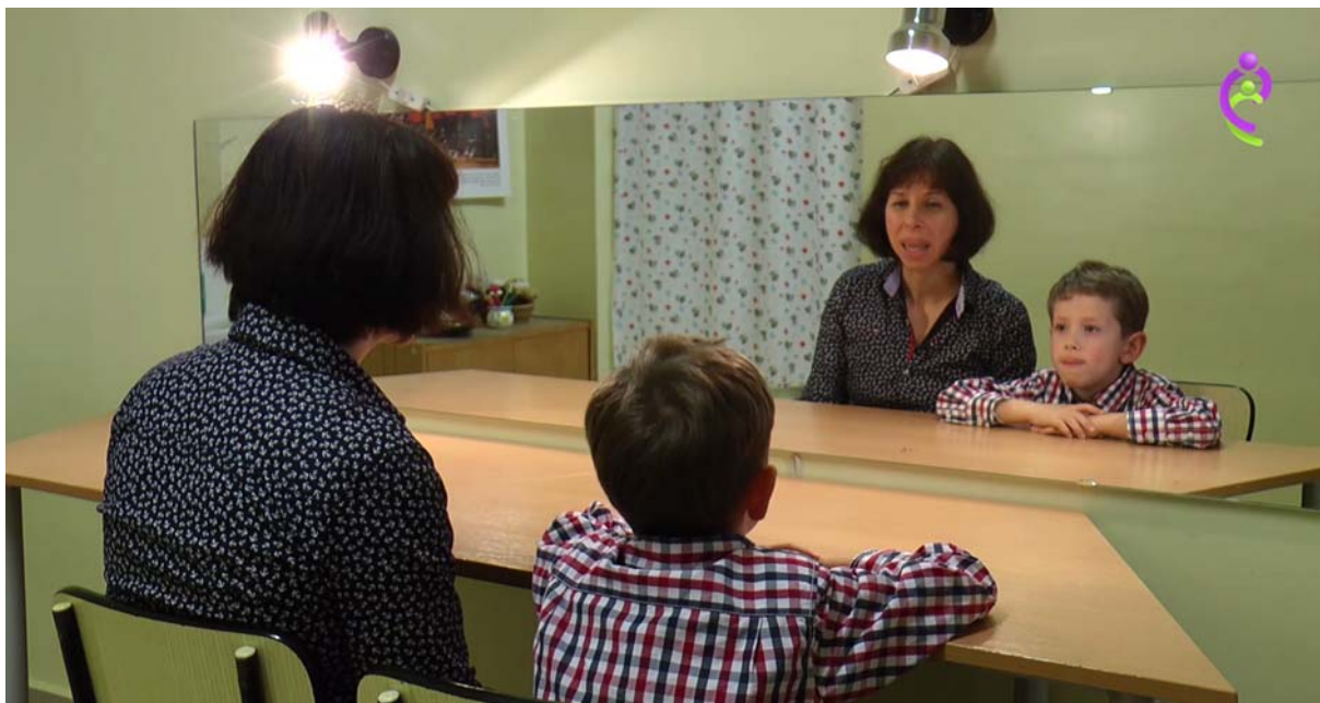
Artikulációs torzítások terápiájához kapcsolódó előkészítő gyakorlatok

Elképzelésünk arra irányított minket, hogy az artikulációt javító terápia sarkalatos mozzanatait (hangdifferenciálás, hangfejlesztés) logopédusi kompetenciában tartva, a hosszas begyakorlást igénylő, napi ismétlést megkívánó gyakorlatok (előkészítő ajak- és nyelvgyakorlatok, rögzítés, automatizálás) végzéséhez a szülő kompetenciáját támogassuk. A terápia hangzó voltát figyelembe véve, itt csak videóformátumú gyakorlatok elkészítését láttuk célravezetőnek. Kiválasztva a leggyakrabban érintett hangokat (sz, z, c, s, zs, cs, r) az artikulációs terápia ívére felfűzve fejlesztettünk játékokat, melyek szintén egységes szerkezetben (megszólítás, gyakorlat bemutatása, tanács) kínálnak gyakorlási mintát.