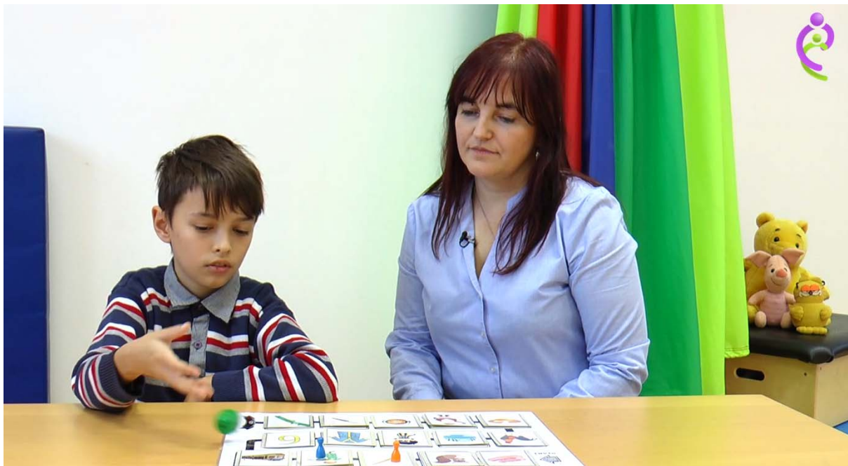
Automatizáló gyakorlat társasjátékkal

Összességében az artikulációs torzítások javítását célzó terápia támogatására az online tanácsadó anyag több mint 200 filmet foglal magába. A szülőknek ajánlás ezúttal is e-térben zajlik majd. A terápia tanácsadásban való ellátási módja – hasonlóan a nyelvi késéshez – itt is igényli a logopédusi figyelmet, melynek gyakoriságát, hosszát a kezelő logopédus egyénileg határozza meg. E blokk elkészítése folyamatban van, az FPSZ honlapján történő közzététele hamarosan várható.