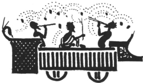
Köpeczi Bócz István rajza