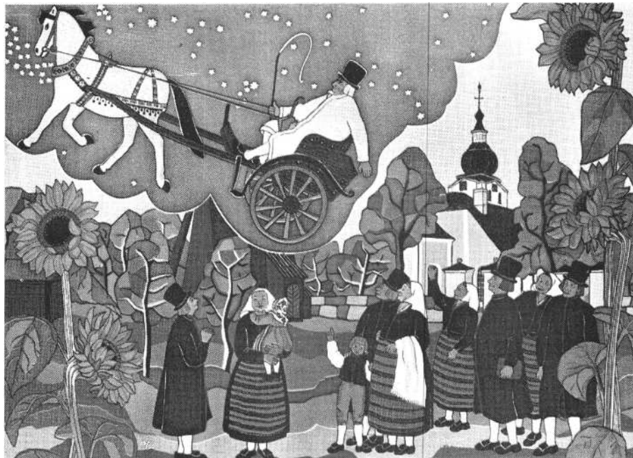
Dalarnai parasztház falfestménye: Éliás mennybemenetele

A színészek pályakezdő fiatalok, nagy részük frissen végezte el a főiskolát, és a produkció saját vállalkozásuk. Nem tagadom, volt is az egésznek valami „csinálnád magad” amatőr slamposága, ami különösen a világítás és a jelmezek sze-