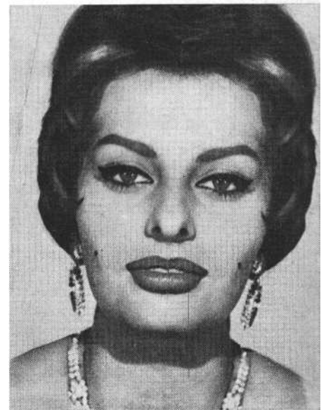
Sophia Loren aszimmetrikus és szimmetrikus arca

mas szabványszépséget eredményezhet. Ennek igazolására jó példa Sophia Loren valódi, aszimmetrikus és fotótrükkkel készült szimmetrikus arca.