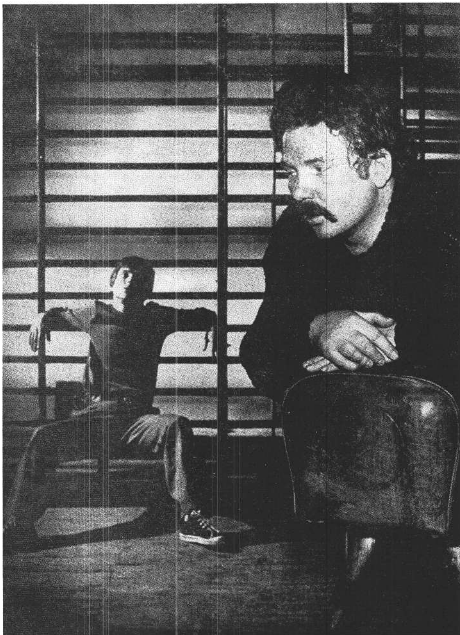
Ireneus Iredyński: Isten veled, Júdás című színműve a gdanski Teatr Wybrzeźében

lengyel arisztokrata családból származó Ewelyna Hańskát. Iwaszkiewicz meglehetősen hagyományos stílusban írta komédiáját, amely ezáltal egy ironikus irodalmi paródia vonásait öltötte magára. E csupa humor színjátás nemcsak az író irodalmi kulturáltságáról árulkodik, hanem kiváló írástechnikájáról és mély történelmi környezetismeretéről is.