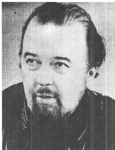
Peter Hall, a Nemzeti Színház igazgatója volt, önálló társulatot alapított

Két olyan tekintélyes drámaíró van, akinek hírnevét az évtized igencsak megnövelte: Alan Ayckbourn és David Hare.