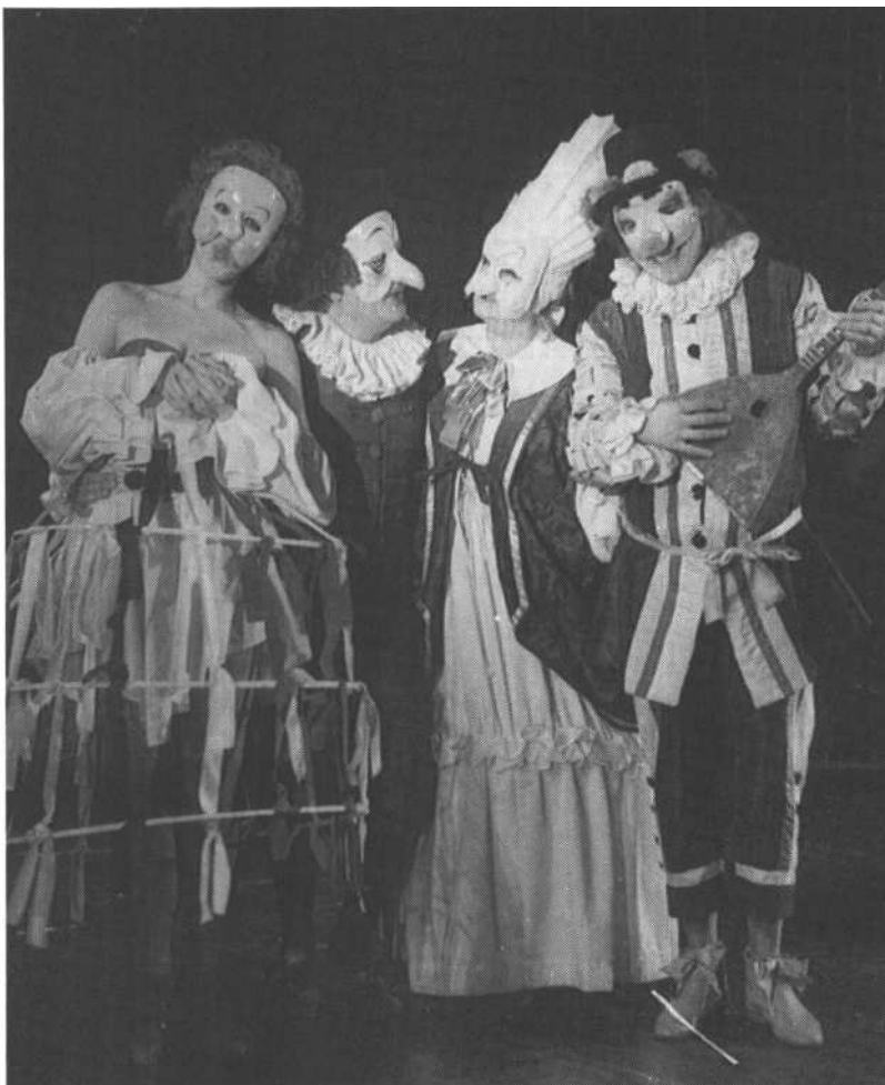
Jelenet a Képmutatók cselszövéseéből (Temesi-fotók)

Ez a távolságtartás ugyanakkor nem jelent személytelenséget, ami elsősorban a jó alakításoknak köszönhető. A színészi játék részben igazodik az előadást szervező rituálékhoz, részben túl is mutat rajtuk. A szereplők megmutatják azokat