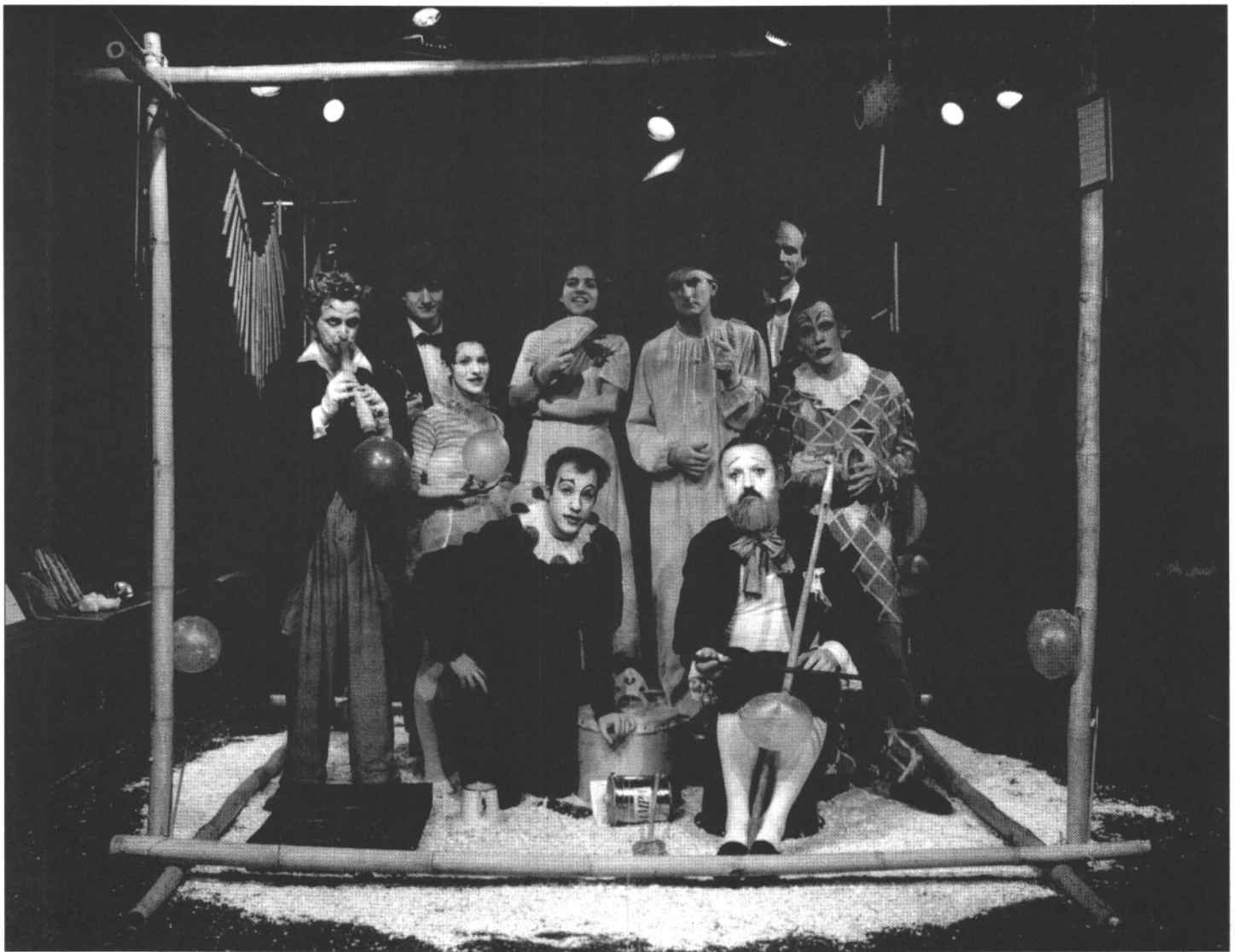
Hólyagcirkusz (Stúdió Fábry)