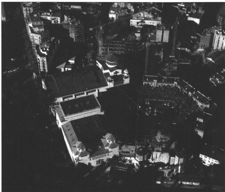
Az építkezés színhelye

kibontakozását, míg a COS-program a táncművészeti produkciókat fogja össze. A Tematikus program több diszciplínát egyesít, tehát a különböző létesítmények összefogásán alapul, és jellemzi, hogy témáit nagyrészt a nemzetközi drámairodalomból választja. Terveznek például olyan sorozatot, amely a Nyugat öt nagy mítoszával: a Prométheusz-, Oidipusz-, Trisztán és Izolda-, Don Juan- és Faust-legendakörrel foglalkozik, az ókortól a mai napig, tehát például Szophoklészről Heiner Müllerig. Végül az úgynevezett Mercuri program a Lliure és a Színházi Intézet együttműködésére épül, és tanulmányi átmenetet tesz lehetővé a pályakezdő fiatal művészek számára az iskolai képzés és a szakmai gyakorlat, vagy ha úgy tetszik, a szakmai piac között. Az átmenet színházak számára egy, rendezők és producerek számára két évből állna. Maximum harmincfőnyi (húsz hazából és tíz külföldről álló) tanulmányi csoportokban zajlik majd ez a posztgraduális képzés, a színházi szakma minden diszciplínájából, így a bábművészetből és a színházi ügyintézésből is.