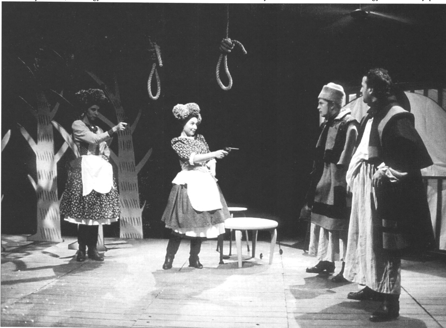
A legjobb alternatív előadás: Kórbáz - Bakony. A Szkéné Színház előadását Pintér Béla rendezte

dező, színész és szövetségesei (idősebbek és fiatalok egyaránt) közreműködésével. Szegeden az új igazgató több csatát -- műhelyépítést, strukturális, közönségkapcsolatit, együttesfejlesztést és -megtartást - elvesztett, értékeket az operaegyüttes és a Kortárs Balett, valamint a Gyalog galopp „termelt”. Szolnok önmaga által is okozott kirekesztettsége ellenére nagy színész- és rendezőegységiségek segítségével értékes Lüszisztraté - és Szerlem -bemutatóval rukkolt elő az emelten ábrázoló, illetve az erőteljesen kifejező rendezői-színészi koncepció és gyakorlat révén. Kecskeméten az új igazgató (Bodolay) több tekintetben megújította együttesét és közönségét, Atyval kontaminálva magyarította Wyspianski