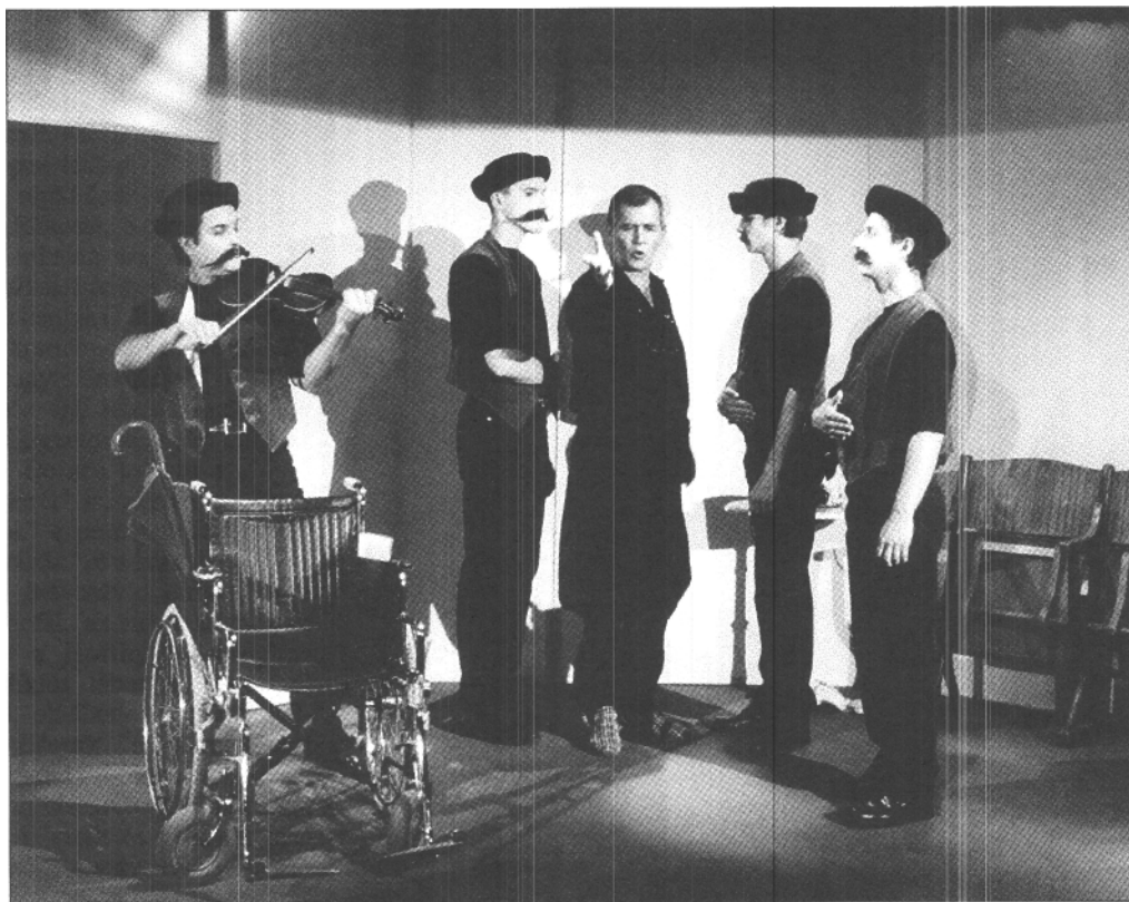
Jelenet a Búcsúszimfóniából

A föld alatti színházak működtetéséhez is három dolog kell: