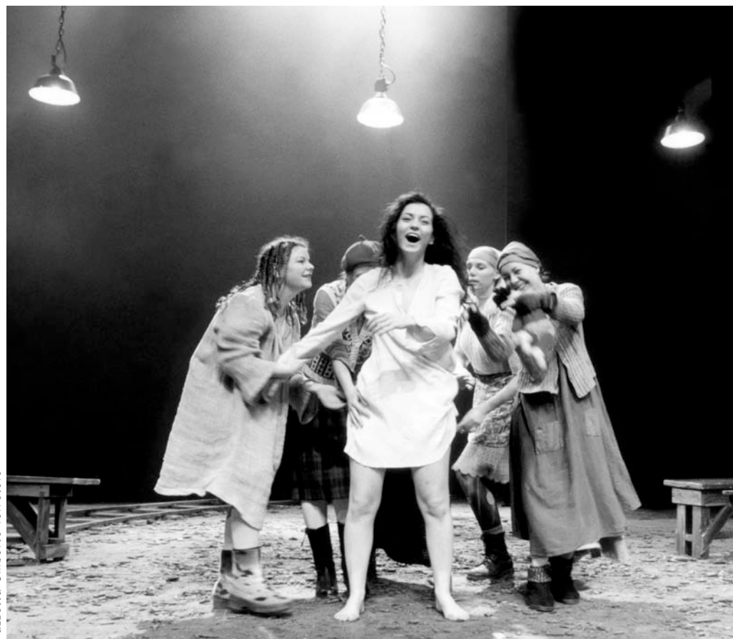
Jelenet a zalaegerszegi Salemi boszorkányokból