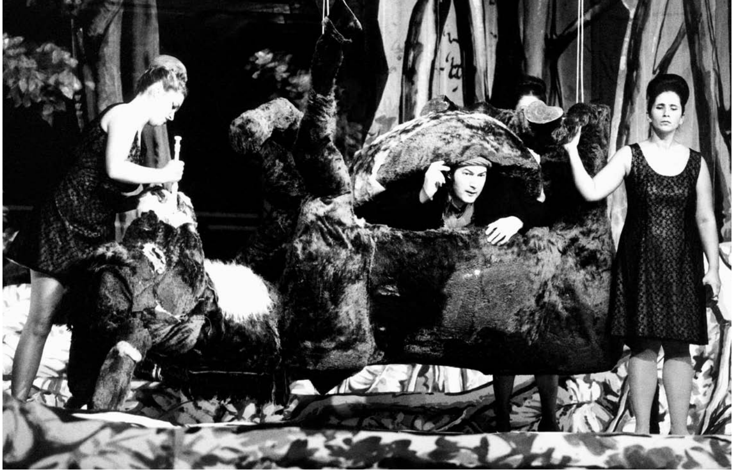
A legjobb zenés előadás a szegedi Szentivánéji álom (rendező: Zsótér Sándor)