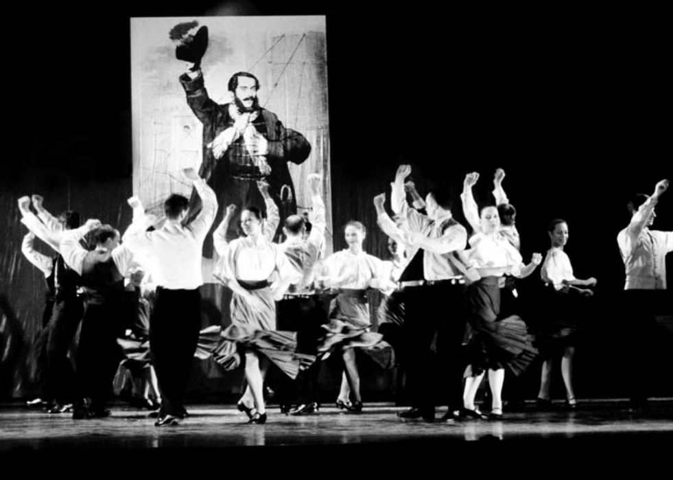
Kossuth Lajos üzenete – a BM Duna Művészegyüttes előadása