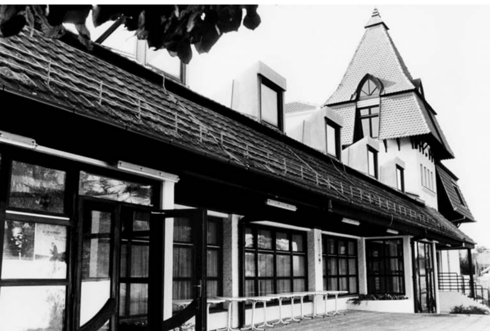
A kanizsai színház