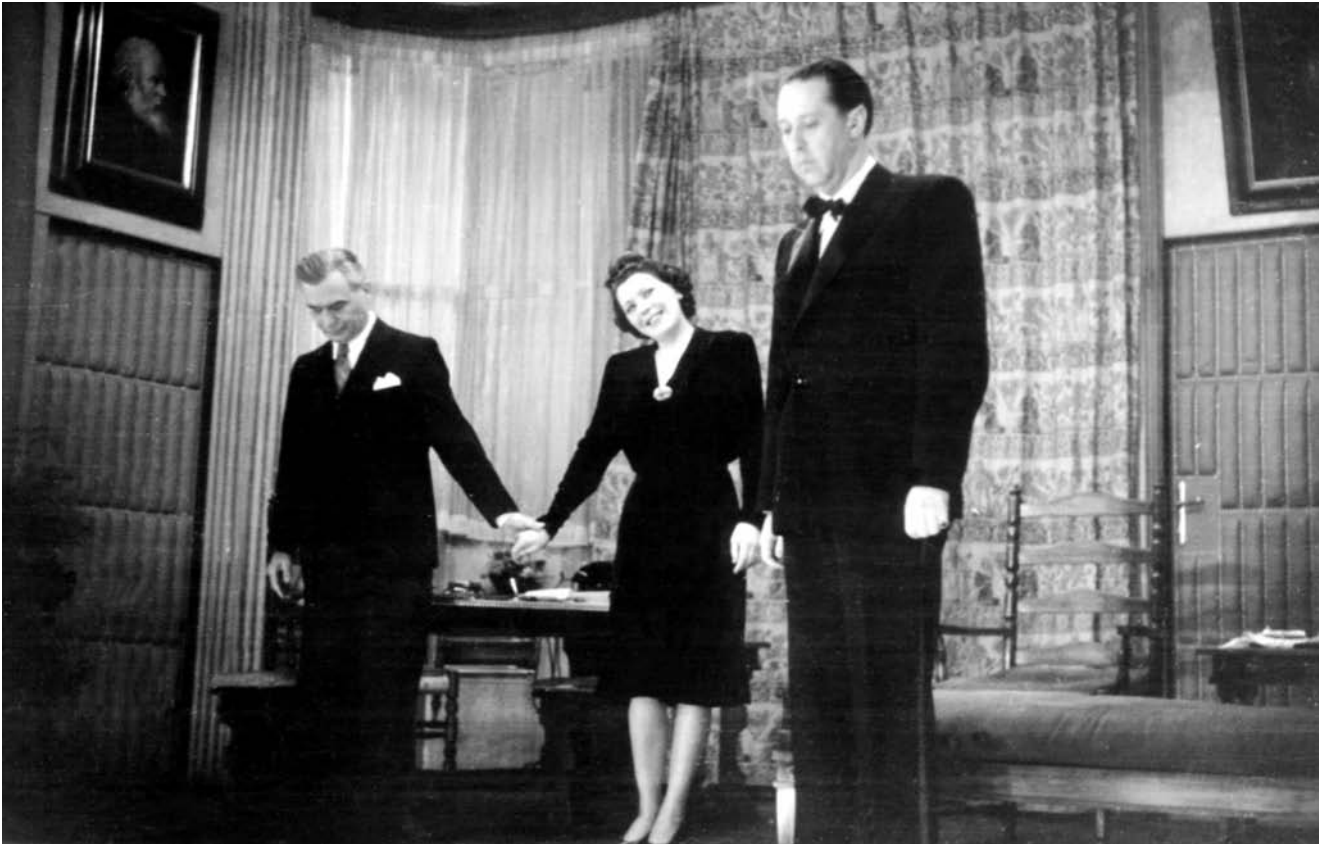
Márai ünneplése a Kaland kétszázadik előadása után (1941. április 17.)