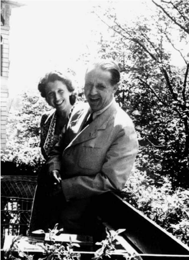
Márai Sándor és felesége az 1940-es évek elején