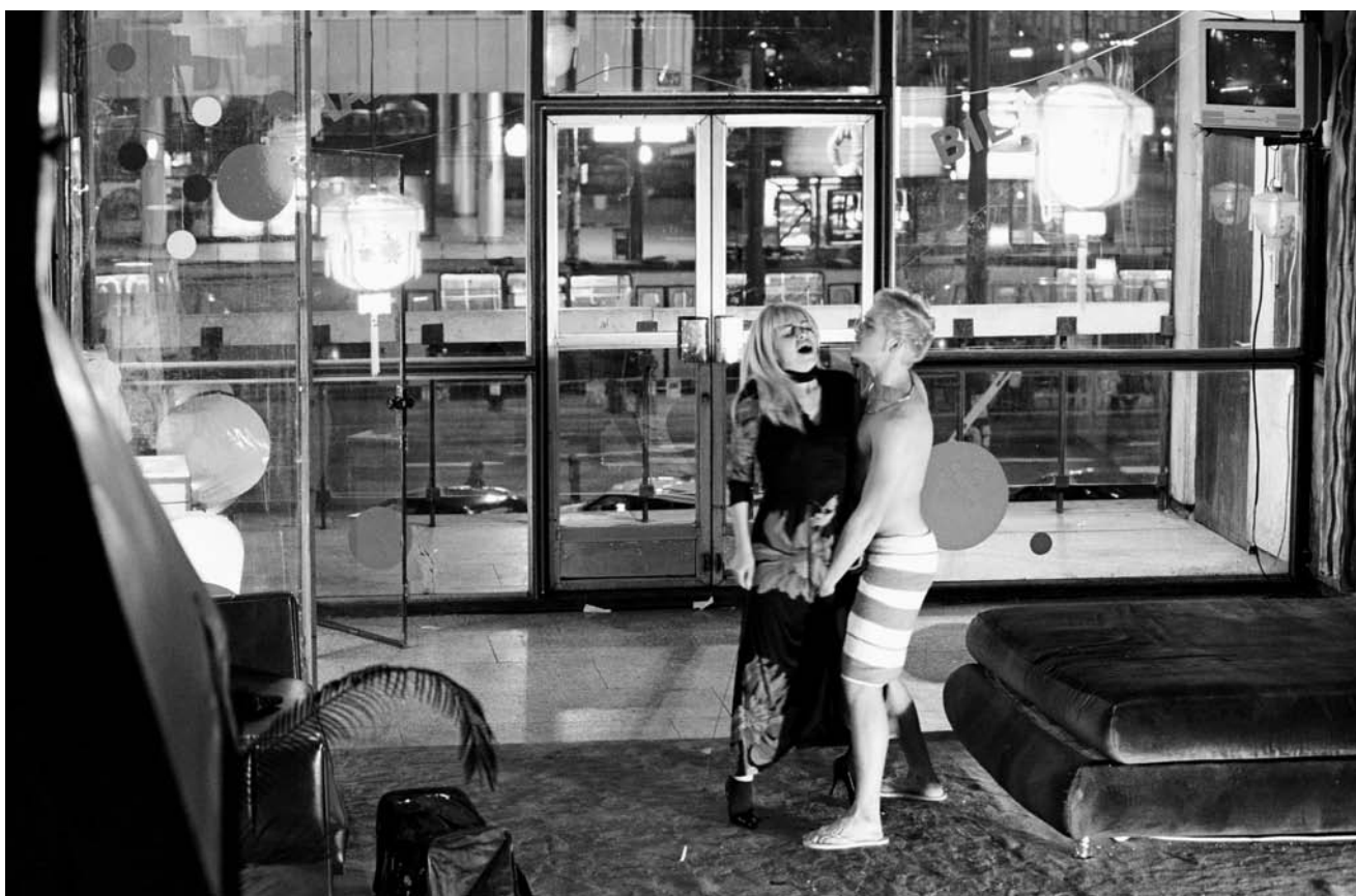
Jarzyna: Mindent egy lapra; Teren Warszawa

az alakok felfedezésének helyszíne. A színész arca a szerepről szóló igazságnak csupán egy részét közvetíti. Csak az első jel, mint Natasa arca, amelyet Miskin megpillant egy fényképen, s ez az arc elcsábíthatja vagy eltaszíthatja, mondhatja azt, hogy „szeress”, de azt is, hogy „ölj meg”. Majd csak a párbeszéd, a szó teszi lehetővé a találkozás titkaiba való mélyebb behatolást. A beszéd elmélyítheti az első benyomást, de teljesen meg is fordíthatja a viszonyt. A szó kötelező érvényű, a szó nem hazudik, még akkor sem, ha csalni próbál. Van, hogy egyenesen szubsztanciális erővel bír: megalkot egy egész eseményt. Vegyük példának a Születésnapot ( Festen ), ahol a szó szörnyetegeket teremt. Először Christianét, a kiegyensúlyozatlan férfit, aki befektíti apját, majd az apa szörnyetegét, aki bevallja, hogy szexuálisan moleztálta gyerekeit. Valaki azt mondhatja, hogy ez a dráma alapszabálya. Természetesen, csakhogy ha a szó nem magából az alakból és annak gondolkodásából fakad, képtelen lesz bármit is létrehozni vagy meggyőzni bennünket az események hitelességéről. A szót át kell élni és át kell gondolni, csak azután szabad kimondani.