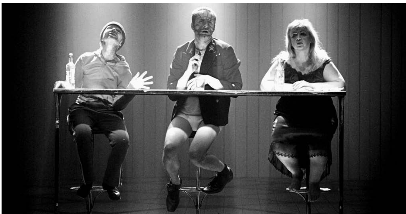
A vihar Warlikowski rendezésében

Warlikowski színházának tapasztalatairól, személyes nyelvéről és költészetéről írt esszében külön fejezetet érdemel a Dybuk .