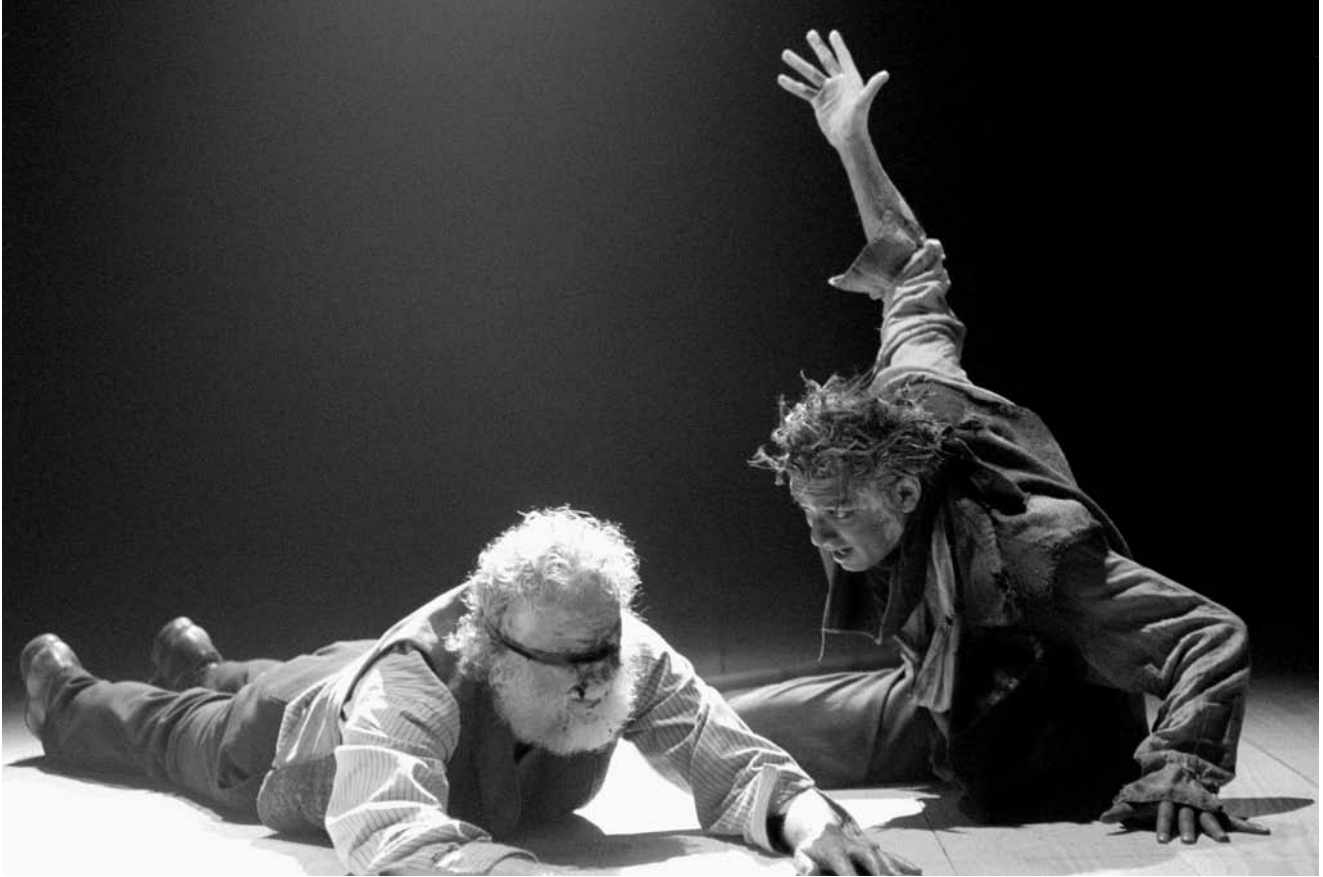
Az RSC Lear király-előadása