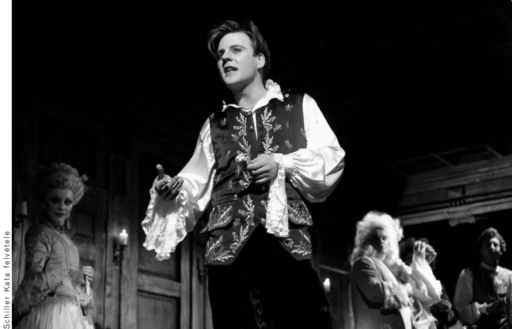
Schiller Kata felvétele