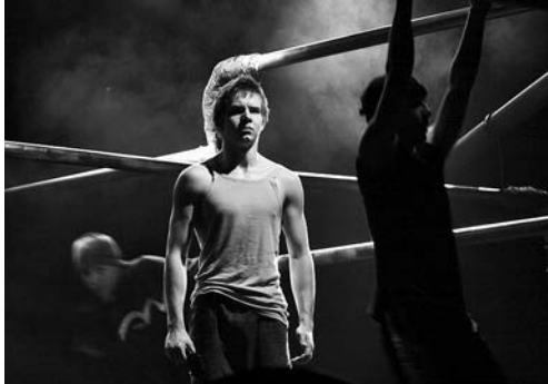
KÓCSAG Kolibri Színház