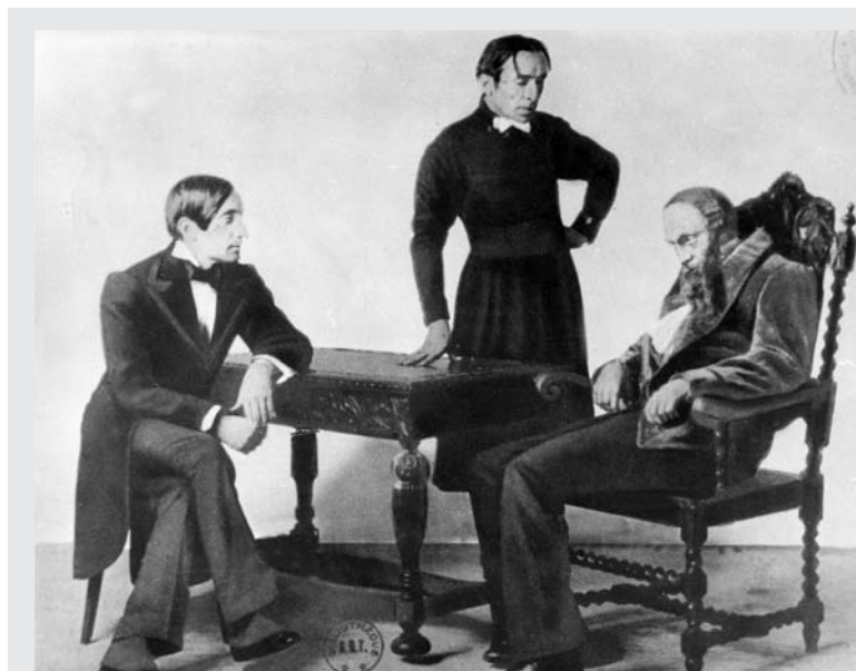
Copeau és Jouvet A Karamazov testvérekben (Théâtre des Arts, 1914)

Festőkről szokás mondani (de miért ne lehetne elmondani bármilyen művészről?), hogy „jó technikája van”. És aminthogy senkinek sem jutna eszébe megdicsérni az író jó helyesírásáért vagy egy költőt hibátlan verslábaiért, ilyenkor sem az iskolás ügyeskedést értik, hanem a módszer eredetiségét, a mondanivaló újszerű kifejtését, amely csak a szóban forgó festő ecsetje nyomán érvényesül, és amely egyedülálló, mert egyéni.