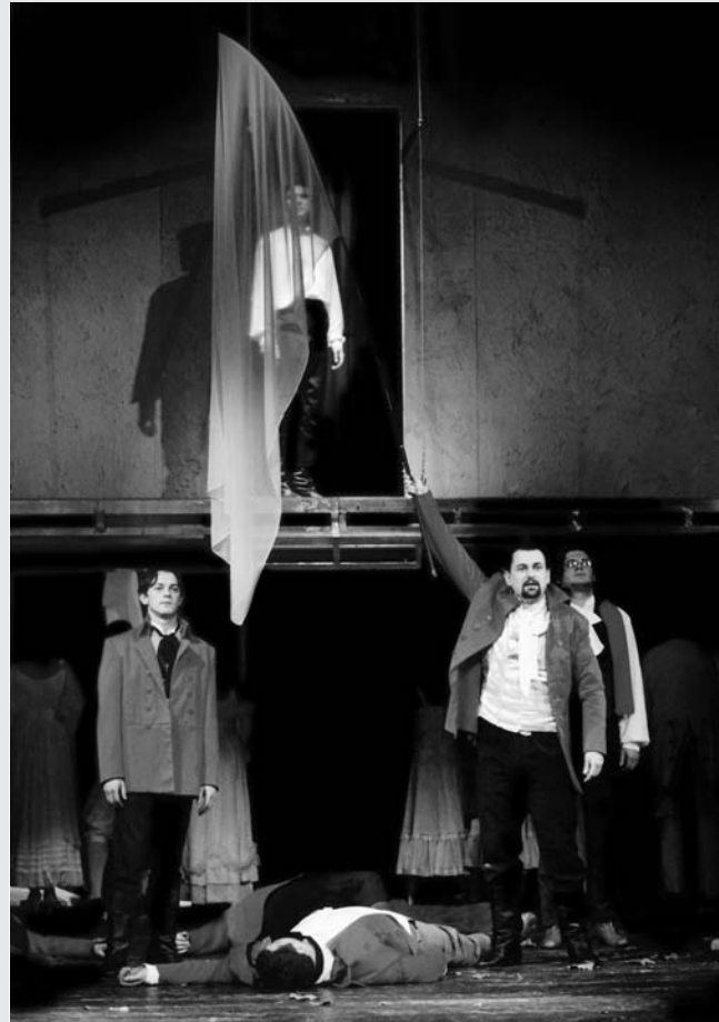
Jelenetek az Előre hát, fiú! című Bodolay-rendezésből