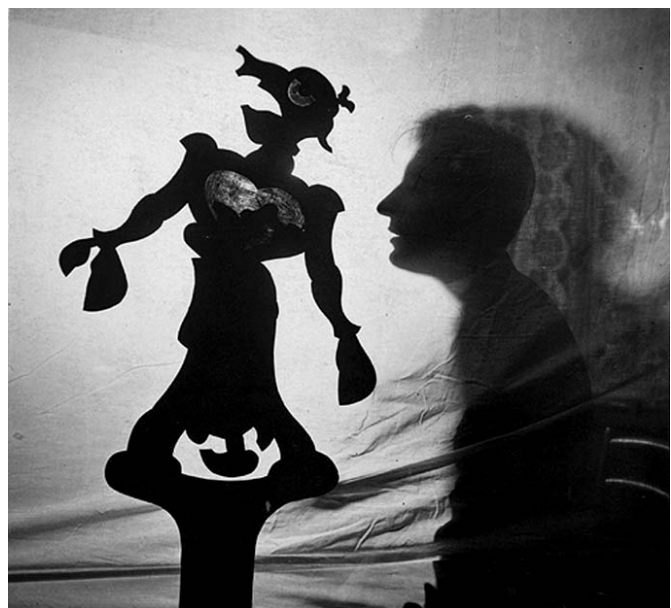
André Kertész felvétele

igazgató” meghívta magához másnapra. Ábel meglepődött, amikor találkozott a „társulattal”: Blattner „kinyitott egy szekrényt, melyben vagy húsz marionett lógott felakasztva, mint a ruhák. Kivett egyet, egy óriási pelikánt, melyet 14 szál mozgatott. Azt mondta, álljak fel egy székre, és próbáljak egy kicsit játszani. Megleptünk mind a hárman, Blattner, a pelikán és én, hogy a bábu belement a játékba, válaszolt, engedelmeskedett, lépdelt és játszott a nagy csőrével, ahogy akartam. Pár perc múlva már a bábu irányított engem” – emlékezett vissza 1983-ban. Ábel az Arc-en-Cielnek számos darabot és kísérőzenét alkotott, és virtuóz bábmozgató lett, később egyszemélyes bábprodukcióival, gyakran csupasz kezére „fejként” húzott fagömbökkel járta a világ kabaréit és tévéstúdióit. „Elbűvölő, nagyon tehetséges komédiás és bábjátékos – írta róla Juliette Gréco, magyarul is olvasható emlékirataiban. – ...A történetek, amelyeket szereplői előadnak – elragadó módon és nem ok nélkül –, magyaros zamatúak.” (Gréco fiatal lányként, a háború idején egy panzióban lakott vele és Gérard Philipe-pel.) A hatvanas évek elején Ábel Amerikában telepedett le, a rochesteri egyetlen franciát tanított. Memoárja ( All told . New York, Simon & Schuster, 1964) – melyben felidézte például Bárdos Artúrral és Molnár Ferenccel kapcsolatos emlékeit vagy együttműködését Orson Wellesszel – magyarul nem hozzáférhető.