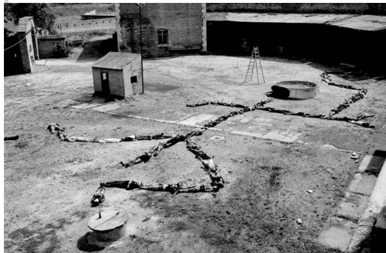
Ember a térben

következetlenségek vannak a jelenetben. Ezek szellemében este újra előadtuk a produkciókat, néhol teljes, néhol jelentéktelen átalakításokkal. Ezután mindenki egyénileg kérhetett véleményt.