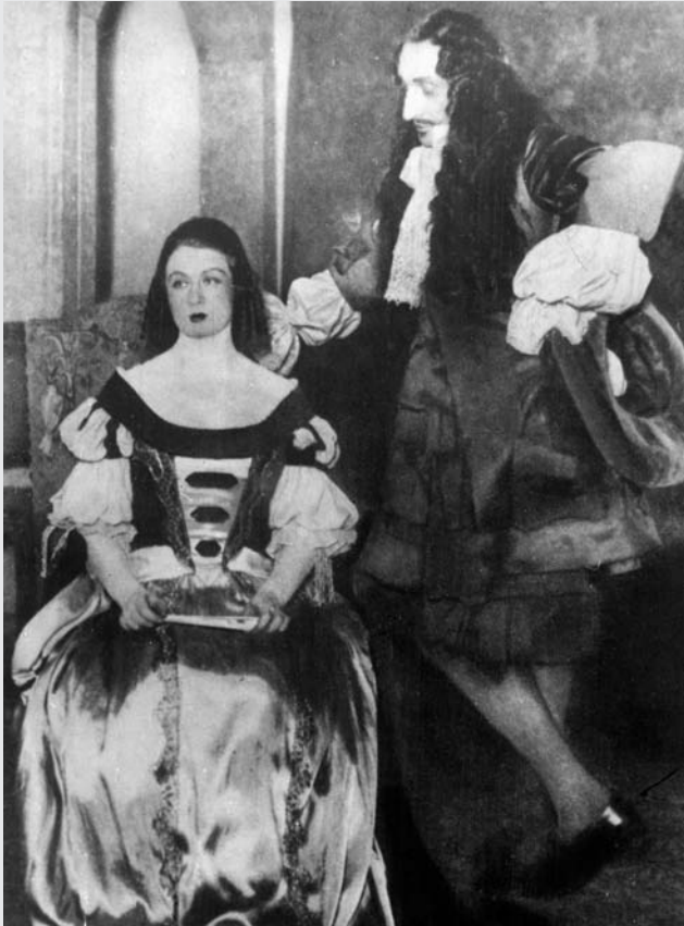
Valentine Tessier és Jacques Copeau A mizantrópban