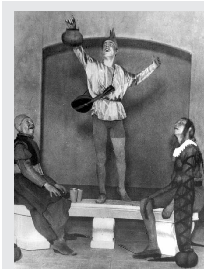
A királyok éjszakája című előadás (1914)

Stendhal azt írta: „Egyszerűen lehetetlen, hogy egy Párizsban lakó francia megmondja az igazat más, Párizsban lakó francia művéről.” És emlékszem egy kritikus mondására is, akinek szemére vetettem, hogy talán kissé messzire ment egy újonnan bemutatott darab dicséretében. Azt felelte: „No de kedves barátom, enélkül nem lehetne megélni!”... Jegyeztem meg ment közben, hogy a ma uralkodó általános udvariaskodás talán a kritikus hangnemét is eltorzította? A javító szándékú megjegyzés, sőt a szívélyesség is mostanában hidegségnek és megvetésnek számít. A legkülsőségesebb kapcsolatokban is túlteng az ömlengő nyájaság, az egymásra licitáló elragadtatás. Tegnap is ismerősök az érzelmektől eltorzult képpel szólítják meg egymást, és „dühöngő ölekezésüket” heves kiáltások, széles gesztusok, virágos szölamok ékítik... Meglepő-e ezek után, ha egy író mellőzésről panaszkodik, amiért a közvélemény nem Racine-nal vagy Shakespeare-rel emlegeti egy sorban?! Ismerünk egy fiatalembert, aki vadul gyalázott egy kritikust, mondván, hogy az nagy kárt okozott neki, amiért nem dicsérte eléggé!