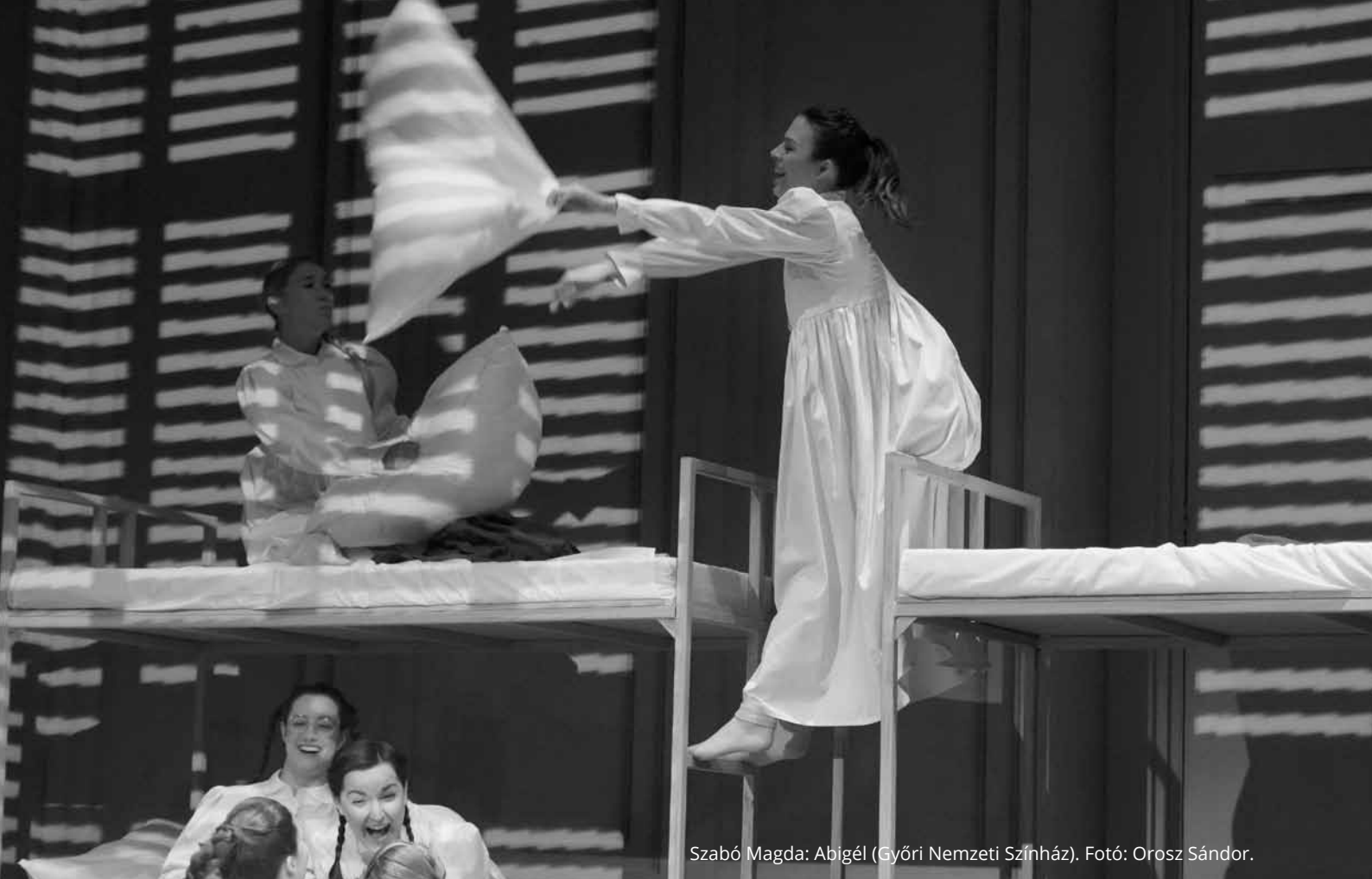
Szabó Magda: Abigél (Győri Nemzeti Színház).

fogadta. Az ilyen típusú műveket gyakran azzal utasították el, hogy a nők nem tudják, hogyan kell drámát írni. [...] Amikor a színház nem illeszkedik a domináns modellbe, túlságosan gyakran azzal utasítják el, hogy értéktelen. Ez különösen igaz azokra a művekre, amelyeket olyan művészek hoztak létre, akik kevésbé jól reprezentáltak a kortárs színházban – kisebbségek, nők, fogyatékkal élő művészek, illetve egy adott társadalmi csoporttal létrehozott közösségi alkotások –, és amelyek többsége nem illeszkedik az elfogadott dramaturgiákba.” 13