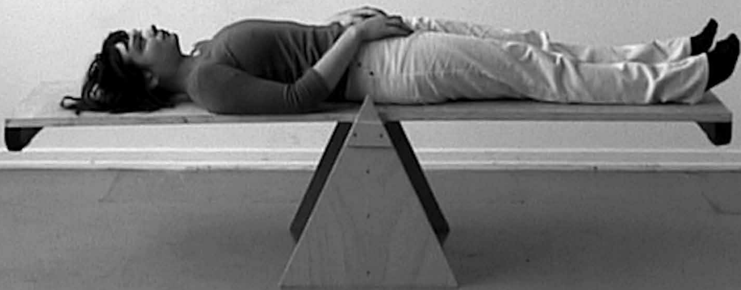
How Heavy Are My Thoughts (video-still, 2003).

Epizódok a lecture performance történetéből