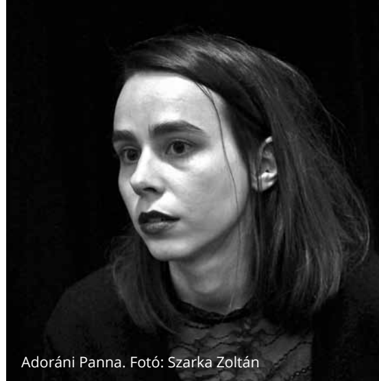
Adoráni Panna.

A. P.: Úgy érzem, kicsit elvesztem. Nem találok azt a részt a „Bevezetés”-ben, amelyet említesz, és az sem rémlik, hogy hol beszél arról, hogy a siker az adott szakmán kívüli megjelenésre vonatkozna. Az általuk felállított algoritmusok ugyanis olyan sikereket vesznek alapul, mint például a Nobel-díj, amely a tudományos (és irodalmi) elismerések non plus ultrája. Azt mondod, hogy a siker egyetemes törvényei mégsem egyetemesek? De miért nem? Számomra a valóságshow kontra művész-színház olyan leegyszerűsítő párhuzam, amivel nem tudok mit kezdeni. Te látod magad alkotóként ebben a dichotómiában? Tény, hogy az adott celeb a saját közössége szempontjából sikeres, és az is tény, hogy nem én vagyok az, aki megszabom, hogy milyen szabályok szerint bíráljanak a valóságshow-nézők. De akkor milyen alapon ítélem meg, hogy az ő sikere legitim, vagy sem? Az én olvasatomban ebben a könyvben nem volt szó abszolút értékrendekről. A félreértés abból jöhet, hogy Barabási általa tisztelt életműveket foglalt bele a könyvbe, és nem Kim Kardashianról írt, és ez már csak az ő elitizmusáról árulkodik, arról, hogy – valószínűsítem – „érzelmileg nem tudja elfogadni”, hogy az, amit Kardashian csinál, teljesítmény is lehet. De attól még a siker egyetemes törvényei az általad említett celebekre is igazak kell legyenek, ha a könyv rájuk már nem tér is ki. Vagy várjuk meg, hogy Kim Kardashian is befejezze a pályafutását, hogy igazán mérhetővé váljon a sikere, mint Einsteiné, s utána nyilatkozzunk róla.