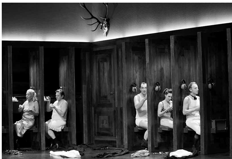
Rechnitz ( Der Würgeengel ), Münchner Kammerspiele.