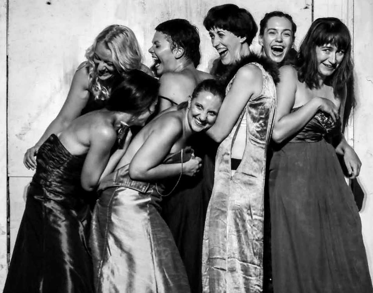
Queendom, r. Szabó Veronika.

jelennek meg az apró dobozszínpadon. A médiatartalmat szimbolizáló szemét ezen túl a díszletben materiálisan is felbukkan: a nézőtér két oldalán megkopott újságok borítják tapétaként a falakat. Ebben az előadásban a trash alantasnak bélyegzett esztétikaként van jelen, amely erőszakosan tör be a védtelen Woyzeck életébe, s hozzájárul mentális betegségének elhatalmasodásához. A populáris kultúra egyben az egyénre veszélyként leselkedő esztétikaként realizálódik, ami az emberi testet üres látványossági cikként és pusztá hústömegként tünteti fel. A sztalkeres előadásokat átható morális töltet, tehát a valódi értékek felmutatásának szándéka a Woyzeck -ben a magas- és az aljakultúra ellentétének kiélezésével jelenik meg (nem mellékesen a Nemzeti Színházban). Más kérdés, hogy az előadás mindeközben mint gegforrásra épít a tömegkultúra műfajaira, főként azokban a pillanatokban, amikor a csapat huszonévesekből álló törzsközönségével sikerfilmrészletek bejátszásával kacsint össze.