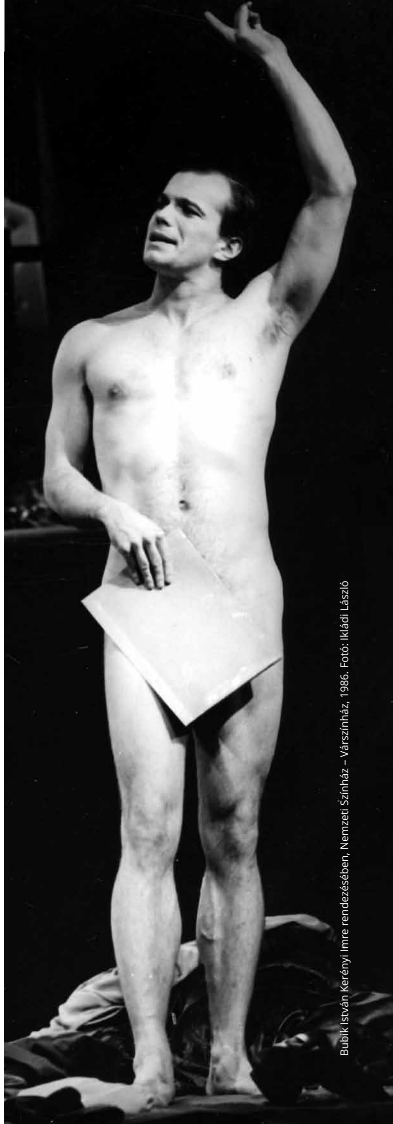
Bubik István, Kerényi Imre rendezésében, Nemzeti Színház – Várszínház, 1986.