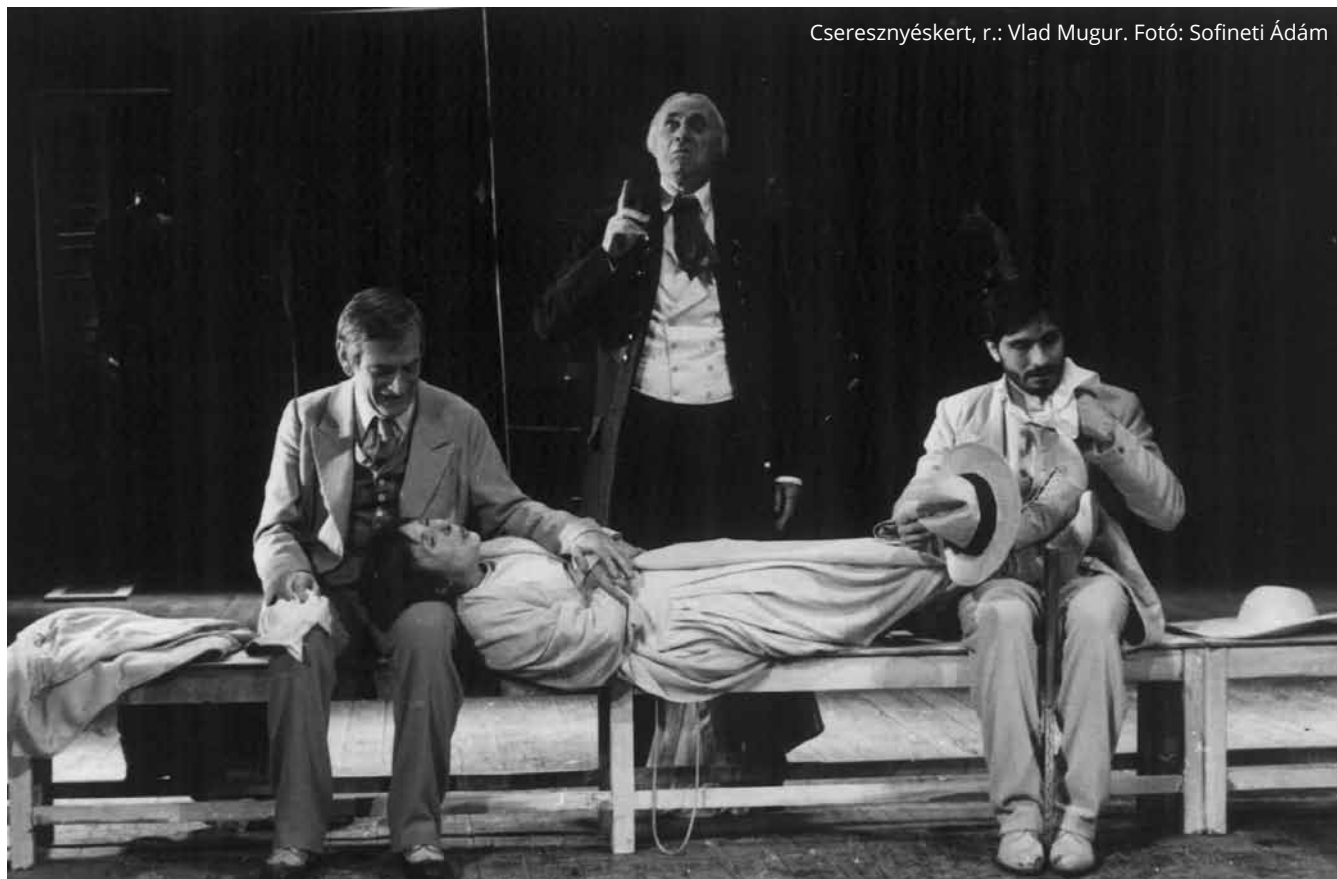
Cseresznyés kert, r.: Vlad Mugur.