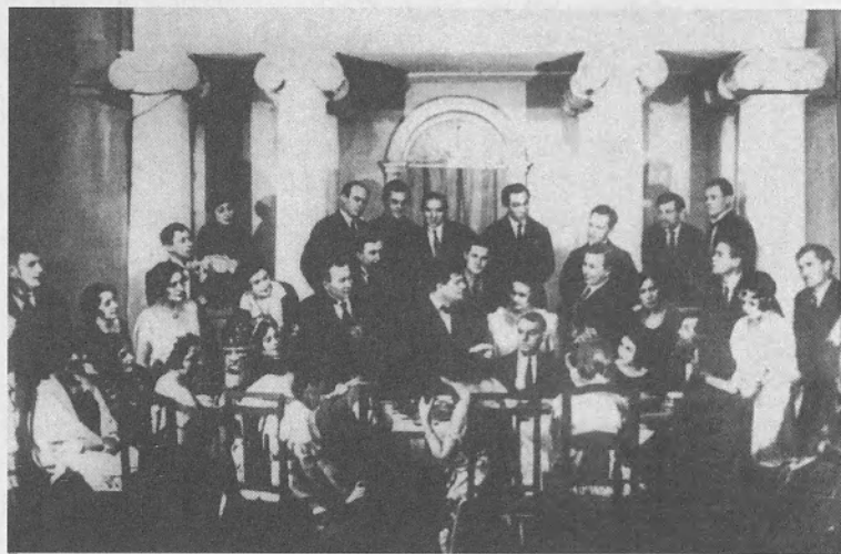
A negyedik jelenet („Teázás”) a Nagy Színház stúdiójában (1922)

A partitúra szerint az unatkozó vendégsereg, meghallva a Rotnijjal érkező zenekar hangját, hirtelen felélénkül. A kórus a háziasszonynak hálálkodik („Bravó, bravó, nem vártunk ennyit...”). A birtokosok csoportban járulnak elé kézcsofokra, lépteik olyan súlyosak, akárcsak a kórus basszus szólama. A vonások rebbenő futamaira a kisasszonyok a mamájukhoz és a nénikéjükhöz iramodnak, akikkel sugdolózni kezdenek. Aztán megjelenik Rotnij is, aki a zene ritmusára katonás tartással lépdel, forgolódik és hajlong a csivitelő leánysereg gyűrűjében. A lányok köszönetet mondanak neki a zenekarért. Megszólal a keringő, a zene ritmusára az asztal mellől a vendégek a terembe özönlenek, legelől a gavallérok, tánra kért hölgyeikkel. A mamák és a nagynénik, a keringőre szaporázva lépteiket, szintén besietnek, hogy