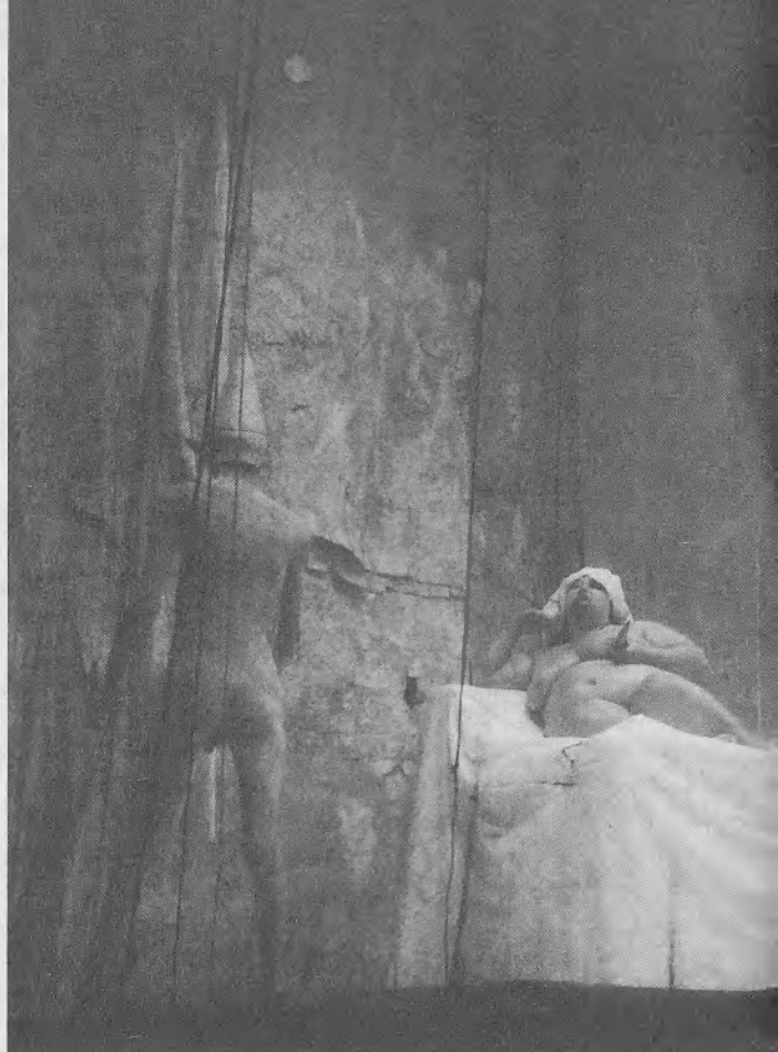
Jelenetek az Oreszteiából

A hiányzó részletek. Talán épp emiatt, a részletekre és a nyelv szaggatottságára kevésbé ügyelő hiánynak